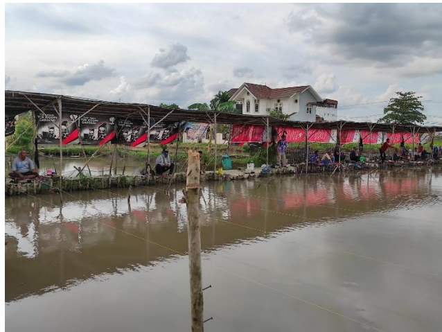
(suasana kolam pemancingan mahat Kasan)