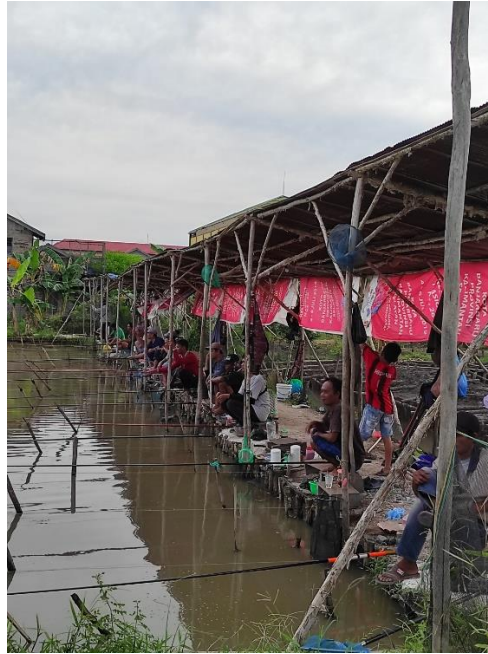
(suasana kolam pemancingan Mahat Kasan)