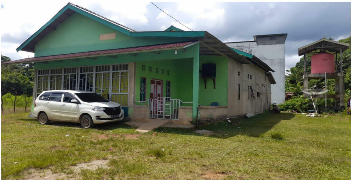
Gambar 6 Tempat kegiatan Majelis Al-Kautsar di Desa Tanjung Lalak

Dan hasil dari data yang penulis peroleh dilapangan bahwa Majelis Al-Kautsar belum memiliki surat keterangan izin berkegiatan dari Kantor Kementrian Agama, Namun karena mendapatkan izin dari pemerintah daerah setempat sehingga Majelis Al-Kautsar bisa melakukan kegiatan keagamaan di Desa Tanjung Lalak Kecamatan Pulau Laut Kepulauan Kabupaten Kotabaru.