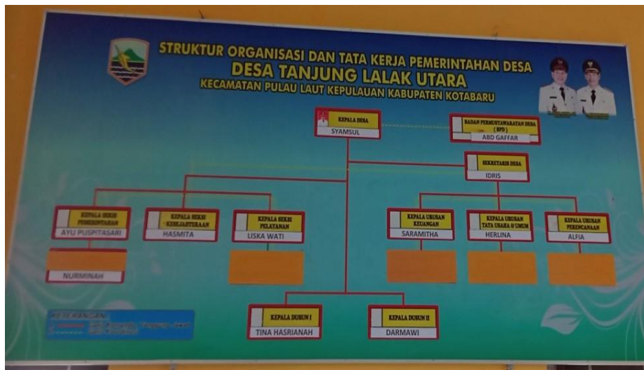
Gambar 5 Struktur Kepengurusan Desa Tanjung Lalak Utara Tahun2022

patuh kepada atasannya. Kecenderungan suka mengamuk yang sulit didamaikan dan dikendalikan. Sungguh pun demikian harus diakui bahwa didalam keadaan-keadaan sulit ia tidak menampakkan sifat-sifat pengecut dan sering kali menunjukkan bukti-bukti keberanian pribadinya yang mengagungkan. Mandar adalah daerah dari Sulawesi barat yang mayoritas masyarakatnya menganut agama islam, 97% orang-orang mandar beragama islam dan 3%nya adalah agama-agama lain yang dianut oleh pendatang.