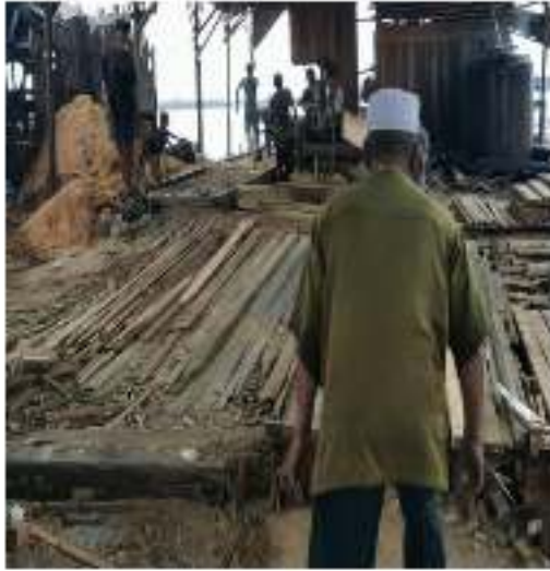
Proses Pengerjaan Kayu