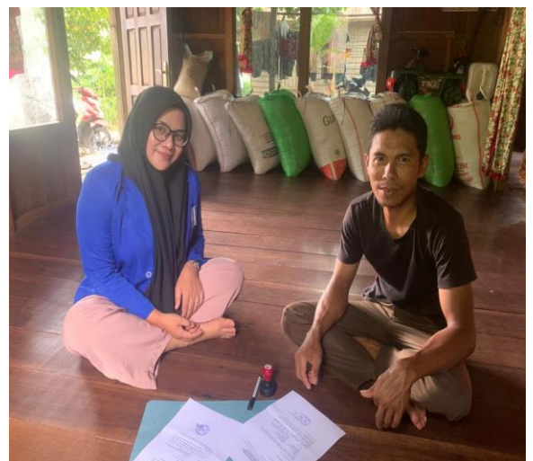
Gambar 6 Foto bersama Kepala Desa Nateh