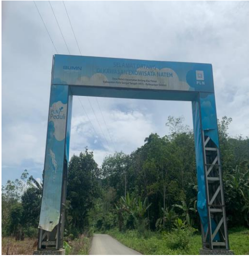
Gambar 1 Jalan masuk Desa