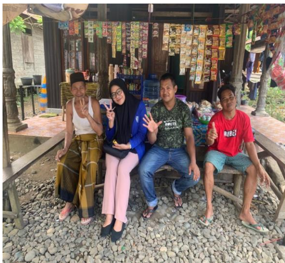
Gambar 5 foto bersama para informan