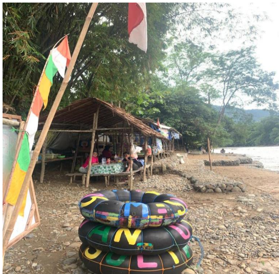
Gambar 3 Penyewaan Pelampung