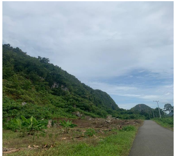
Gambar 4 Jalan menuju lokasi objek wisata