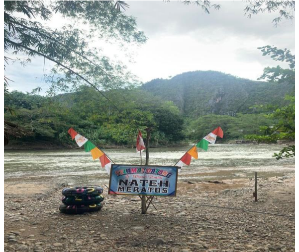
Gambar 2 Lokasi objek wisata