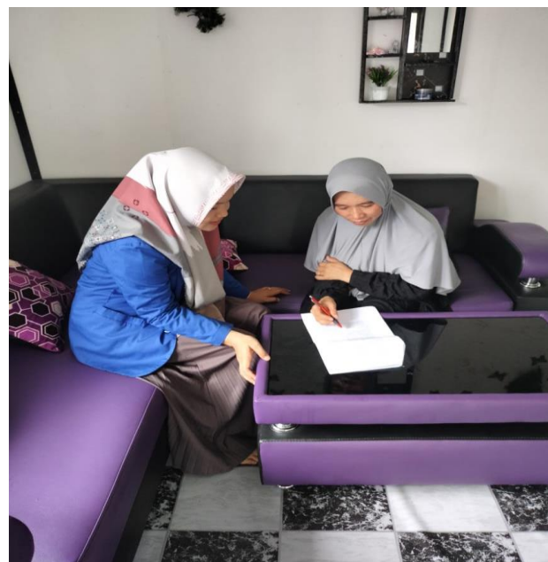
Dokumentasi pengisian angket