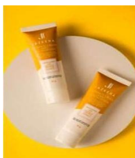
Gambar IV Produk JJ Cream dan Foundation