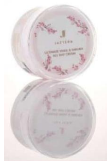
Gambar X Produk Ultimate Snail dan Sakura All Day Cream