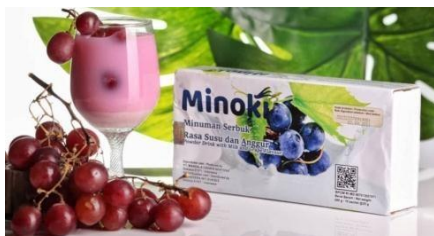
Gambar IX Produk Minoki Jazeera