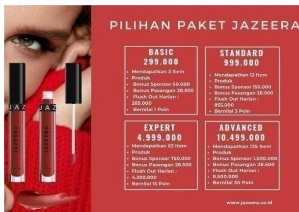
Gambar III Pilihan Paket Jazeera