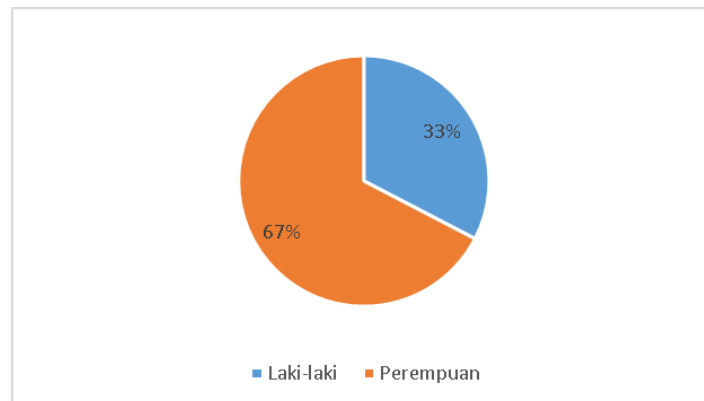
Gambar 4.1 Diagram responden berdasarkan jenis kelamin