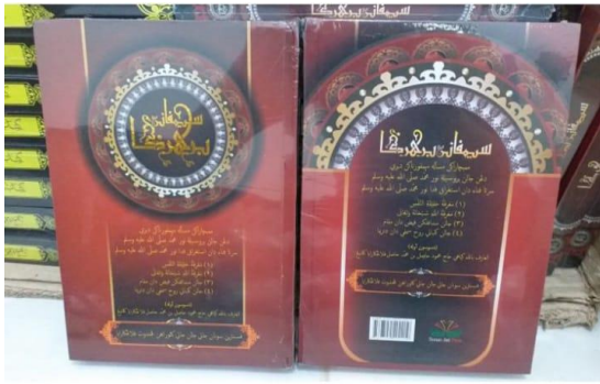
Kitab Simpanan Berharga