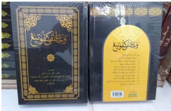
Kitab Waja Sampai Kaputing