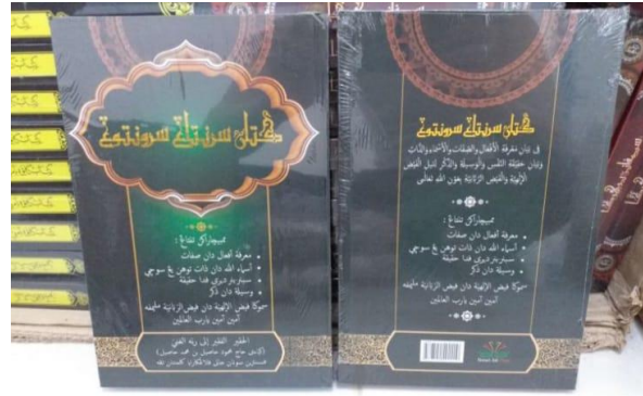
Kitab Sarantang Saruntung