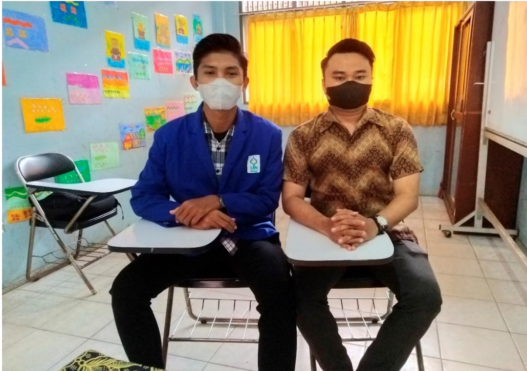
Gambar 3: Wawancara dengan Wali Kelas 7 C SLB Negeri 2 Banjarmasin