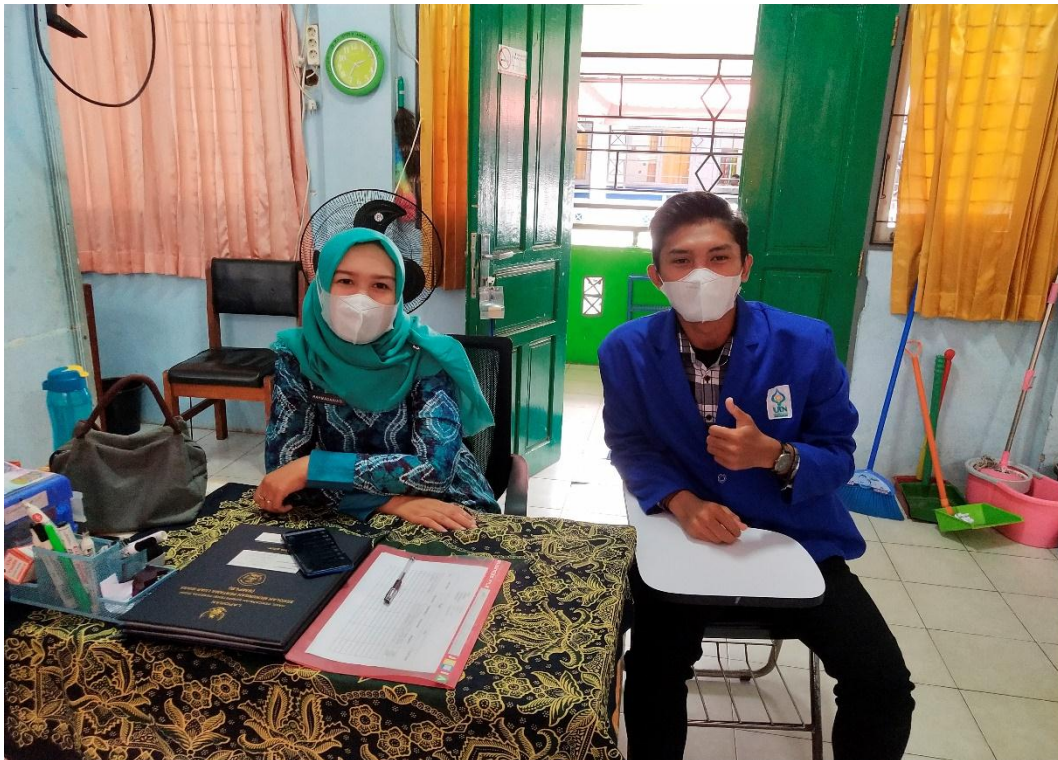
Gambar 5: Wawancara dengan Wali Kelas 9 C SLB Negeri 2 Banjarmasin