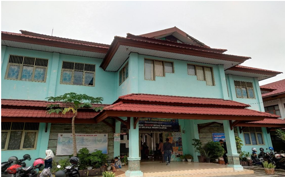
Gambar 1: Keadaan SLB Negeri 2 Banjarmasin