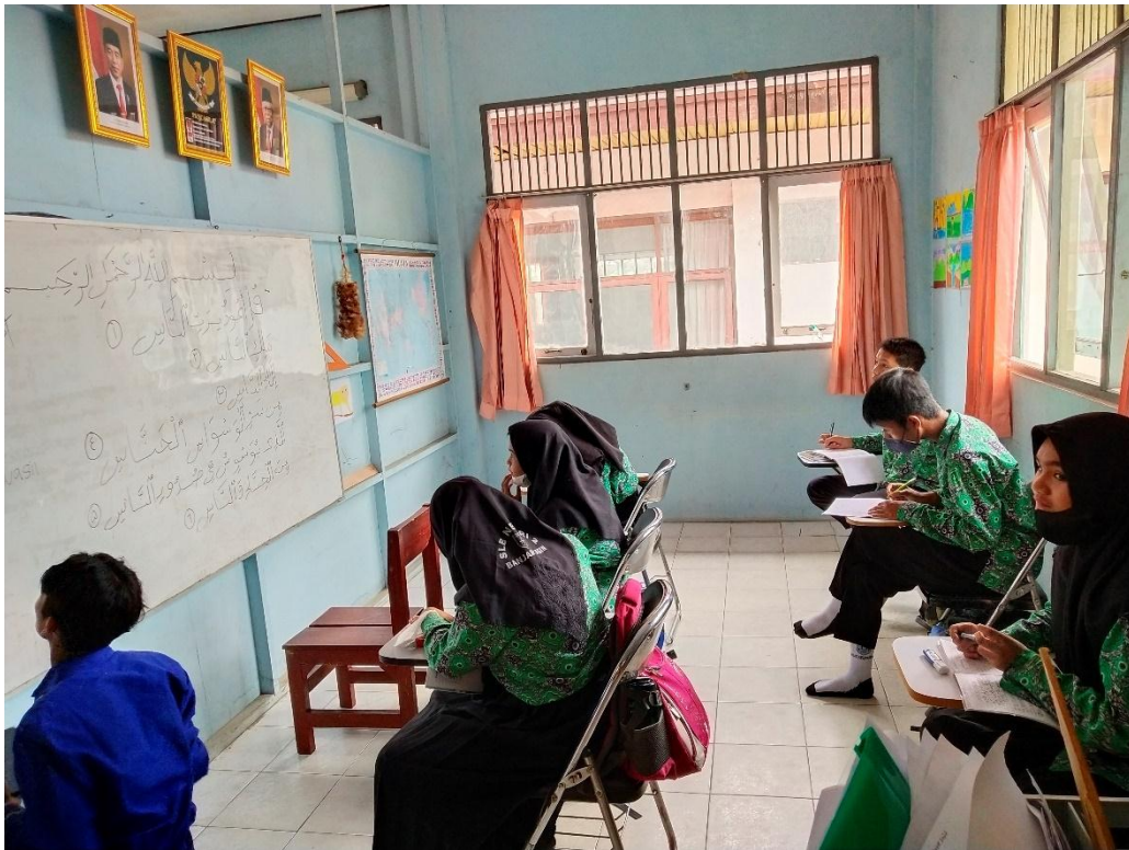
Gambar 7: Observasi Kelas 8 C SLB Negeri 2 Banjarmasin