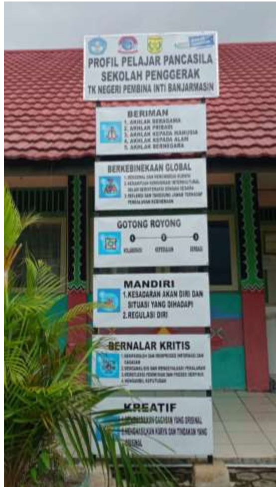
TK Pembina Banjarmasin Tengah