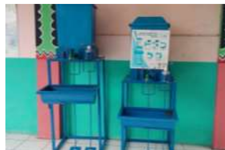
Tempat Cuci Tangan