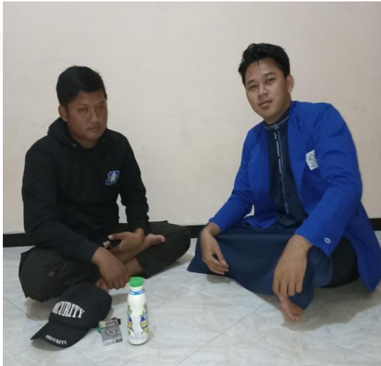
Ketua Karang Taruna