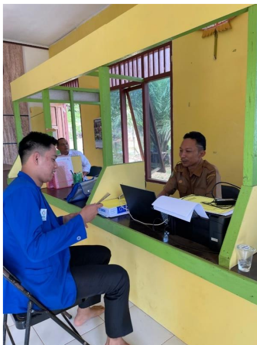
Kaur Keuangan Desa Karya Bersama