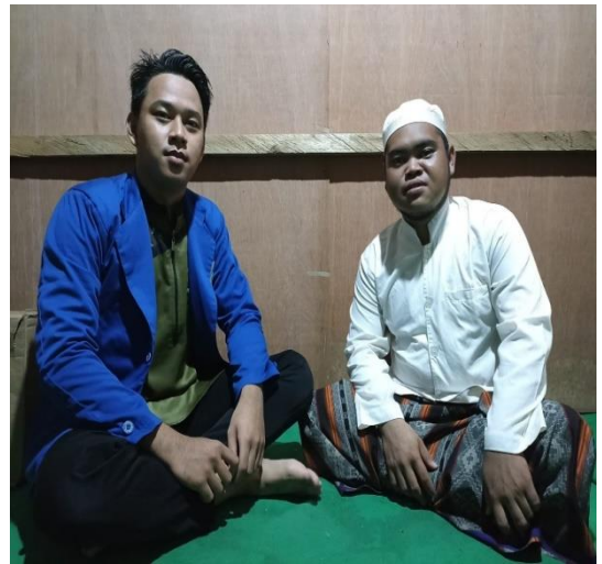
Ustadz Masjid Al-Ikhlas