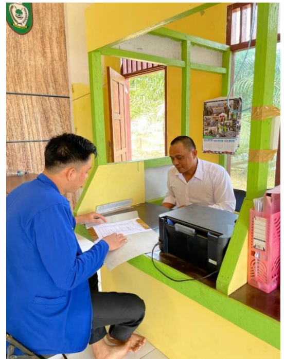
Sekretaris Desa Karya