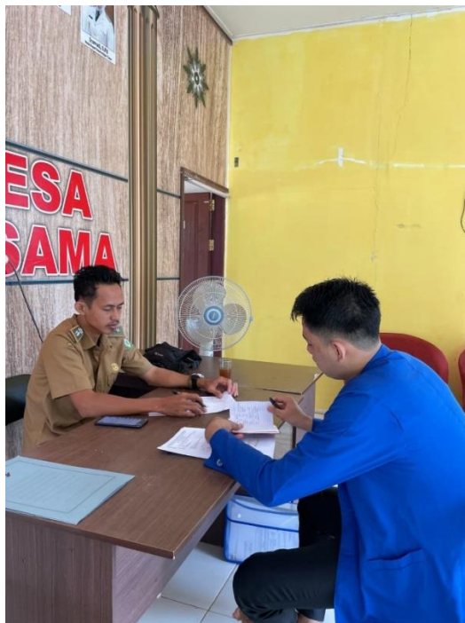
Kepala Desa Karya Bersama Bersama