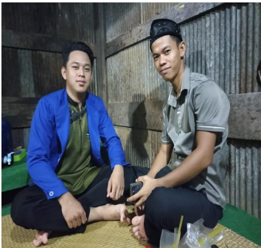
Ketua RT.01 Karya Bersama