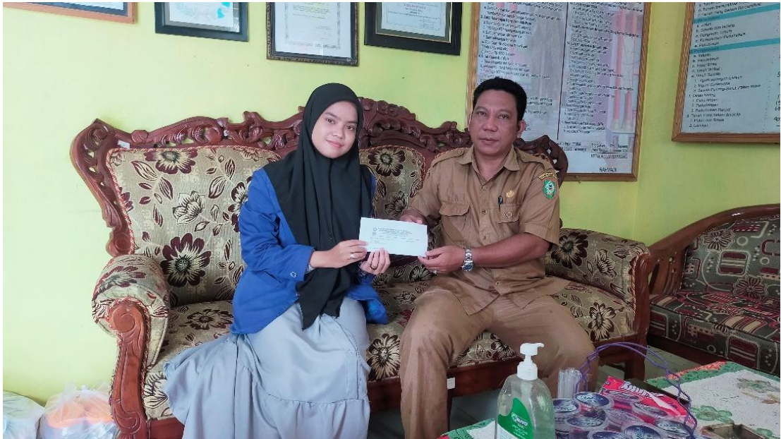
Dokumentasi 2 : Wawancara Informan