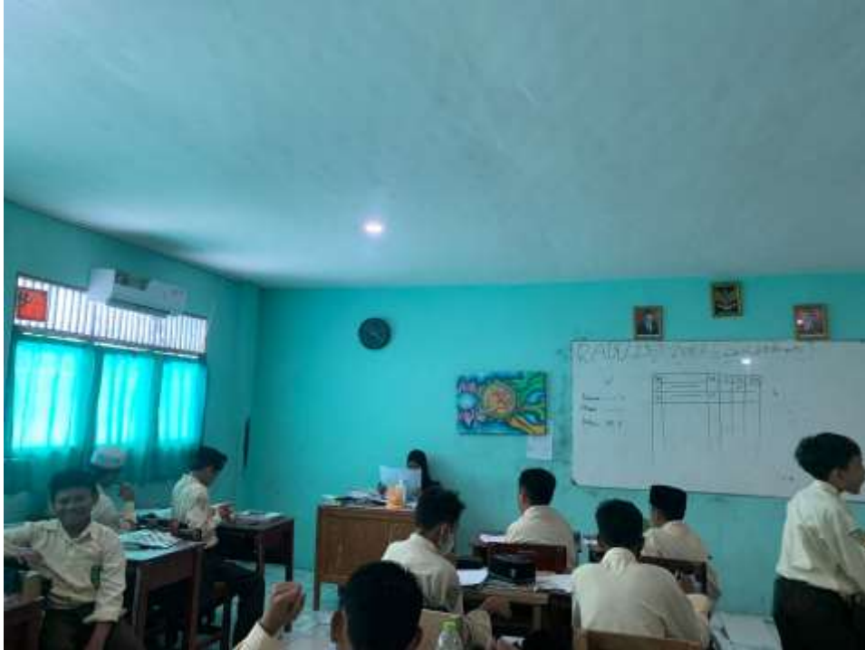
Foto pelaksanaan Riset