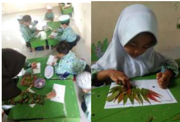
Gambar 4.18 dan Gambar 4.19 Kegiatan Anak dan Hasil mozaik dari daun

Penilaian berlangsung selama kegiatan pembelajaran dan pendidikan. Peneliti mendokumentasikan semua tahapan pembelajaran anak dan selama kegiatan mozaik, yang mana pembelajaran dari kegiatan mozaik ini sudah bagus dan mengalami peningkatan yang signifikan.