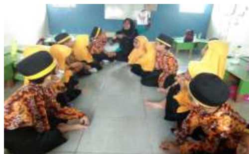
Gambar 4.8 Penjelasan Kegiatan Mozaik

Setelah guru menjelaskan tugas kepada anak-anak, beliau memberikan lembar kerja kepada masing-masing anak. Setelah semua orang menerima lembar kerja, guru mengajak anak-anak untuk memulai pekerjaannya.