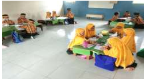
Gambar 4.9 Kegiatan Mozaik Cangkang Telur

Penilaian berlangsung selama proses belajar mengajar. Peneliti mendokumentasikan semua tahapan pembelajaran anak dan selama kegiatan mozaik, masih banyak anak-anak yang dibantu oleh guru.