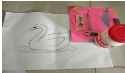
Gambar 4.13 Contoh Pola dan Bahan Kegiatan Mozaik

Penggunaan alat dan bahan dalam aktivitas pembelajaran ini berupa pola bergambar dari kertas origami, dan bahan-bahan mozaik lainnya.