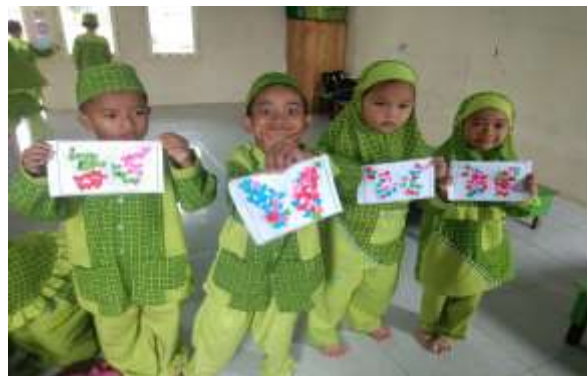
Gambar 4.12 Hasil kegiatan Mozaik Anak

Penilaian ini peneliti lakukan selama kegiatan belajar mengajar berlangsung. Peneliti juga mendokumentasikan semua tahap-tahap kegiatan belajar anak dan selama kegiatan mozaik berlangsung, Selama kegiatan siklus ke-2, anak-anak sudah cukup memahami aturan/prosedur kegiatan dan banyak melakukan koreksi.