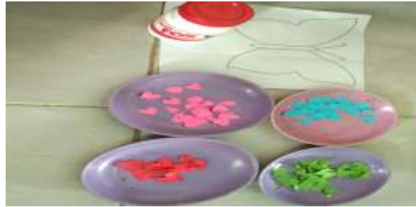
Gambar 4.10 Alat dan Bahan Kegiatan Mozaik