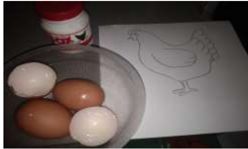
Gambar 4.7 Media Mozaik