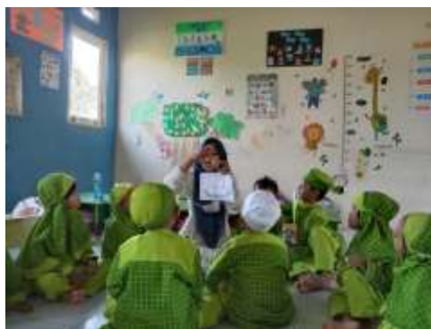
Gambar 4.2 Penjelasan Sebelum Kegiatan

Setelah guru memberikan pemahaman kepada anak tentang kegiatan yang akan dilakukan, guru memberikan lembar kerja kepada masing-masing anak. Ketika semua orang telah menerima lembar tugas, guru menyuruh anak-anak untuk mulai mengerjakan tugas mereka.