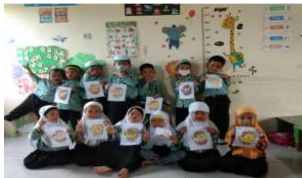
Gambar 4.6 Hasil Kegiatan Mozaik Cangkang Telur

Penilaian berlangsung selama proses belajar mengajar. Peneliti mendokumentasikan semua tahap-tahap kegiatan belajar anak dan selama kegiatan mozaik berlangsung, masih banyak anak-anak yang dibantu oleh guru.