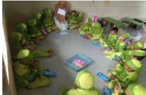
Gambar 4.1 Pijakan sebelum kegiatan mozaik