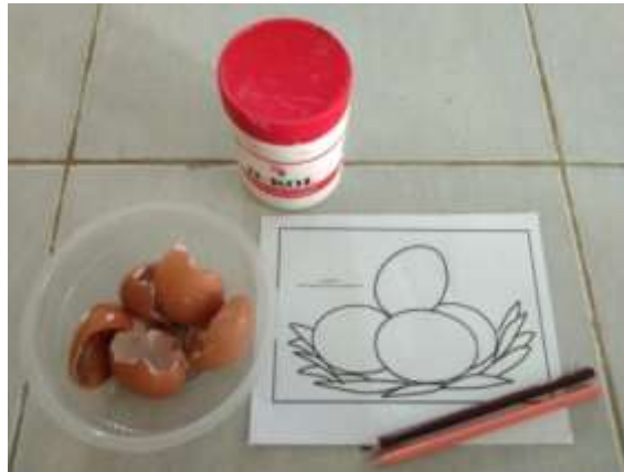
Gambar 4.1 Media Mozaik dan Cangkang Telur

Alat dan bahan yang digunakan dalam kegiatan ini adalah bahan mozaik seperti pola bergambar dan bahan-bahan lainnya.