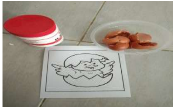
Gambar 4.4 Media Mozaik dan Cangkang Telur

Alat dan bahan yang dipakai dalam aktivitas ini berupa pola bergambar dan bahan untuk kegiatan pembelajaran mozaik lainnya.