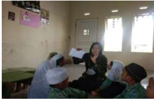
Gambar 4.17 Pijakan Sebelum Kegiatan