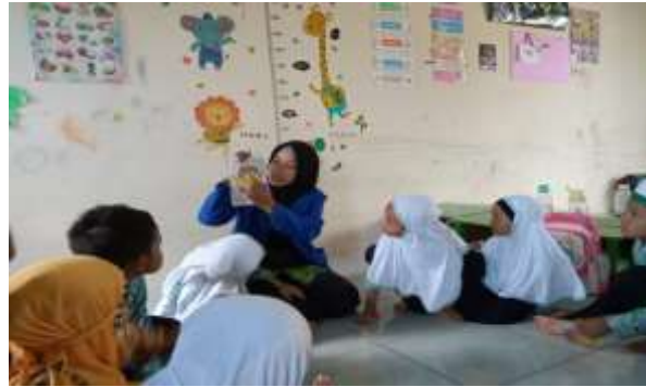
Gambar 4.5 Penjelasan Pola Kegiatan