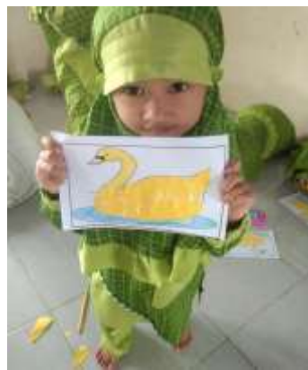
Gambar 4.15 Hasil Kegiatan Mozaik Kertas Origami

Penilaian ini dilakukan pada saat kegiatan belajar mengajar berlangsung. Peneliti juga mendokumentasikan semua tahapan pembelajaran anak, dan meningkat selama kegiatan mozaik.H