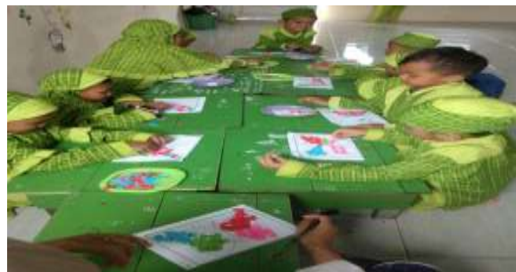
Gambar 4.11 Kegiatan Mozaik Anak