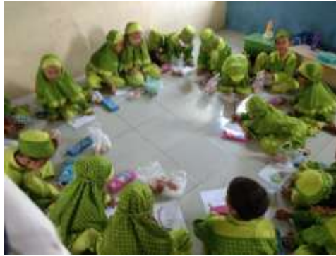
Gambar 4.3 Kegiatan Mozaik Cangkang Telur

Penilaian ini dilaksanakan selama kegiatan belajar mengajar sedang berlangsung. Peneliti juga mendokumentasikan segala tahap-tahap kegiatan belajar anak dan selama kegiatan mozaik berlangsung, masih banyak anak-anak yang dibantu oleh guru.