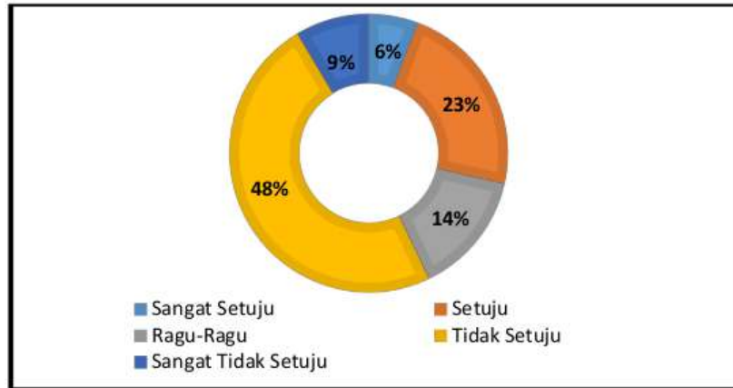
Gambar 3 Pendapat guru tentang sistem pembelajaran online

yang kurang mendukung saat menggunakan media pembelajaran online.