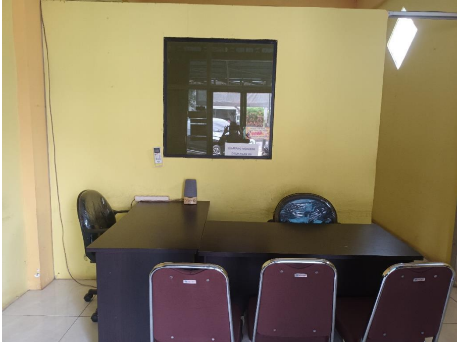
Manajer PT Alanasya Borneo Raya Banjarbaru