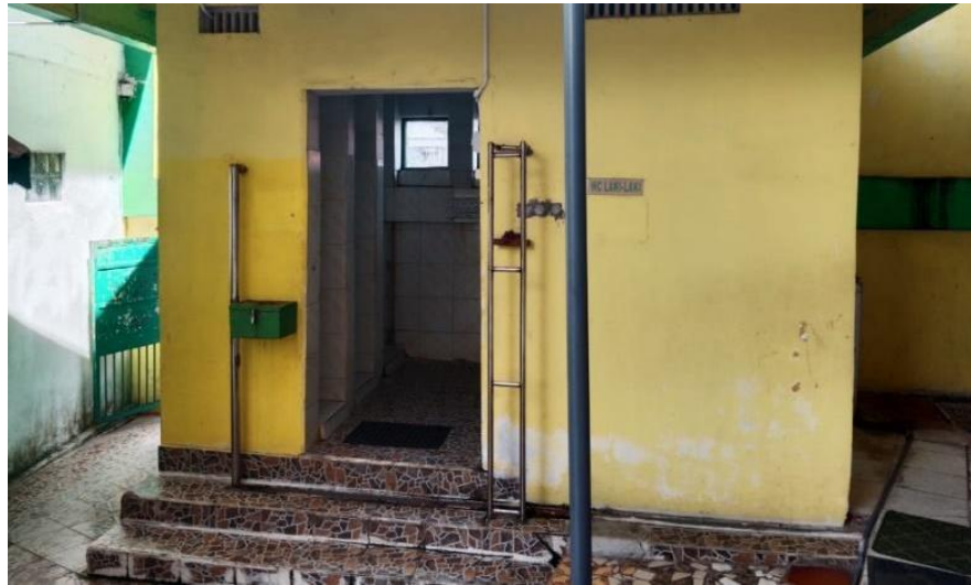
Gambar 4.9 Tempat Wudhu Pria samping kanan Masjid.