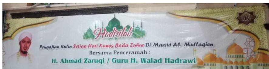
Gambar 4.13 Spanduk Pengajian Hari Kamis

Pengajian yang kedua pengajian mingguan ini dilakukan pada setiap hari minggu tepatnya pada waktu setelah salat magrib sampai menjelang salat isya. Nama lain dari pengajian malam senin atau minggu maghrib adalah Majelis dzikir dan rukun kematian. Pengajian hari minggu setelah salat magrib diisi oleh penceramah guru H. M. Maulana Hanafi. Pengajian hari minggu memiliki perbedaan dengan pengajian yang diadakan pada setiap harinya. Adapun kegiatan yang dilaksanakan pada pengajian hari minggu setelah salat magrib yaitu salat magrib berjemaah, wirid, membaca