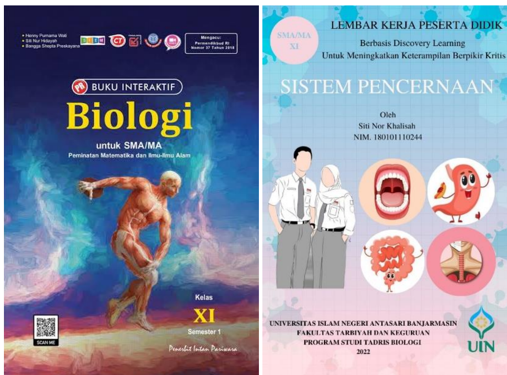
Gambar 3.2. Cover LKPD sebelumnya dan Cover LKPD hasil rancangan