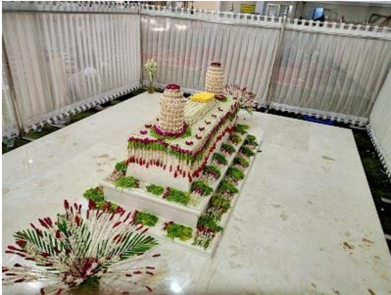
Makam Abah Guru Zuhdi