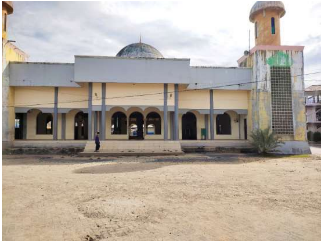
Masjid Pondok Pesanten Darul Ilmi