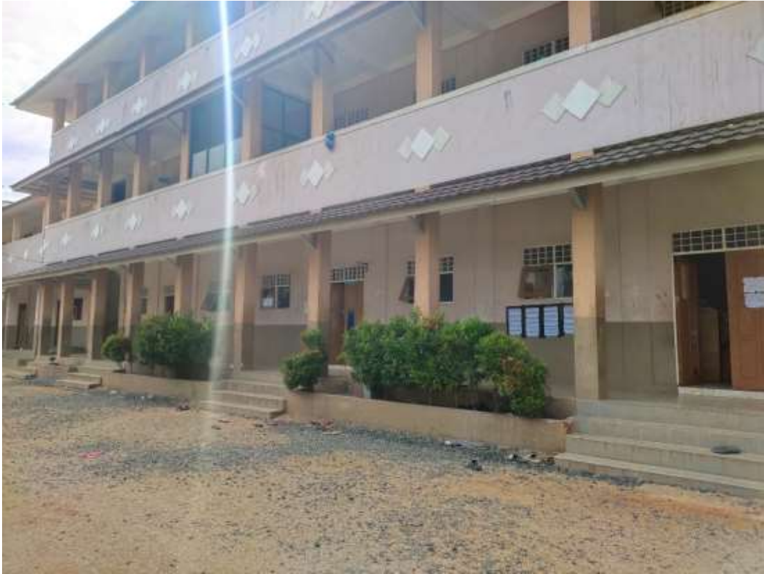
Asrama Putra Pondok Pesantren Darul Ilmi