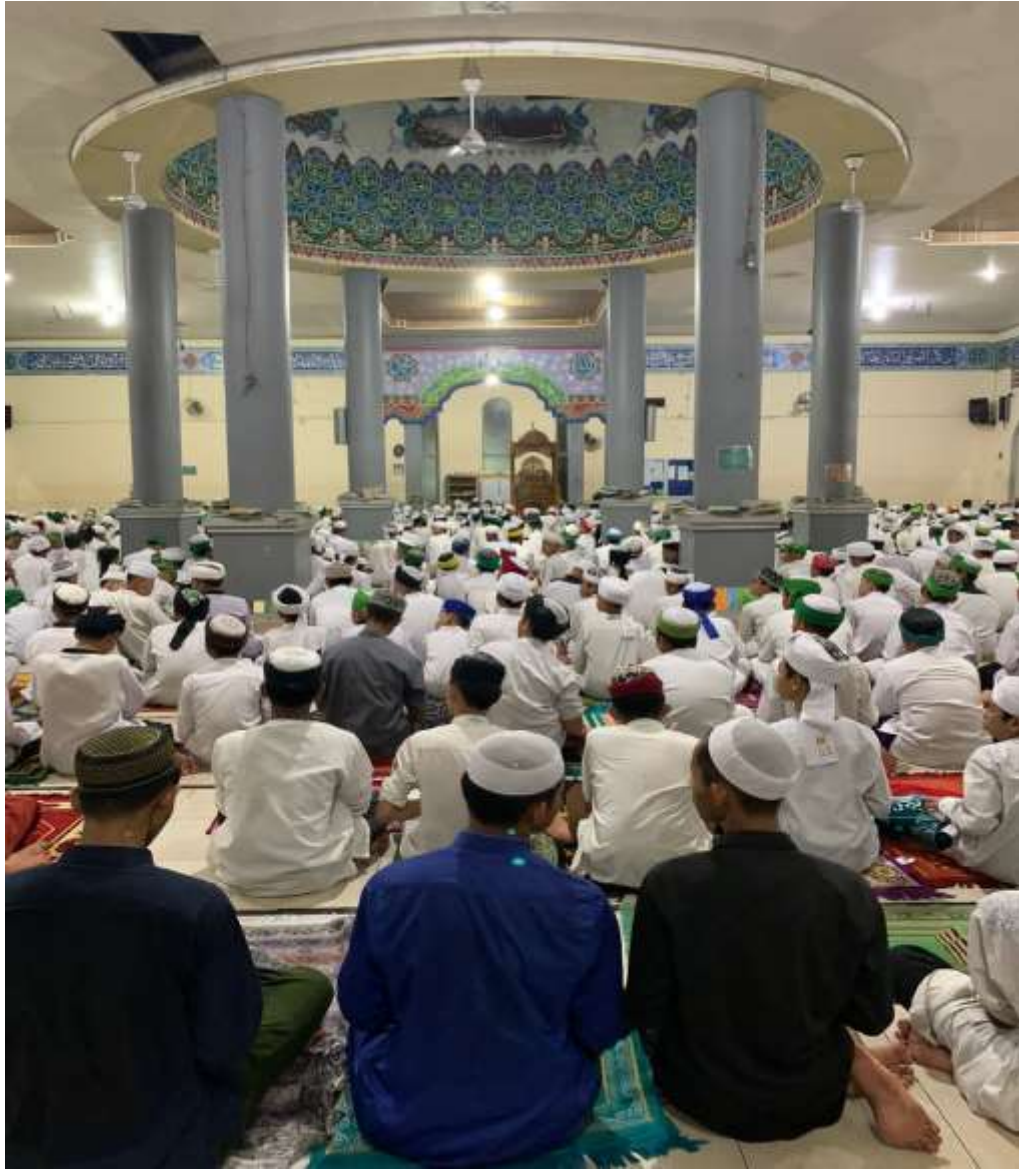
Pelaksanaan Shalat tahajud pada jum'at subuh