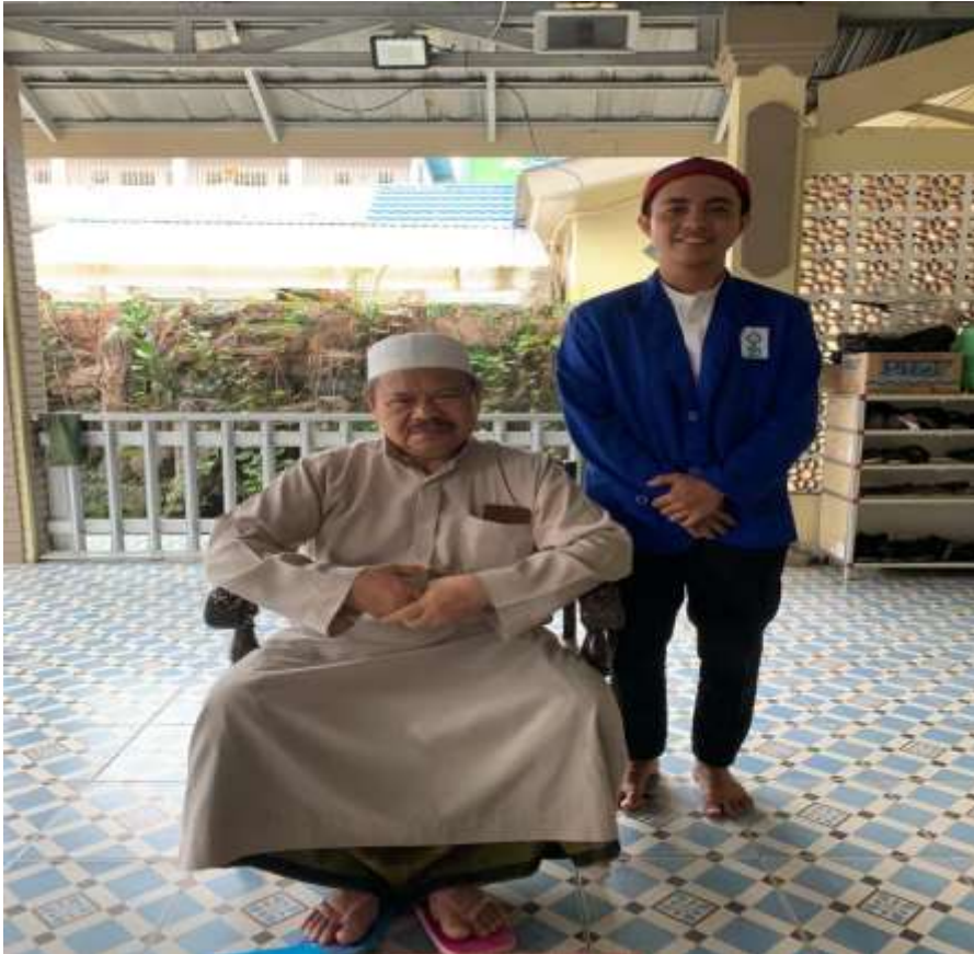
Dokumentasi izin penelitian dengan pimpinan Pondok Pesantren Darul Ilmi