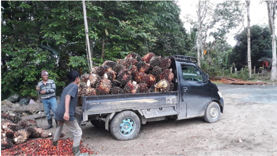
- Tampak buah kelapa sawit setelah selesai di kumpulkan.