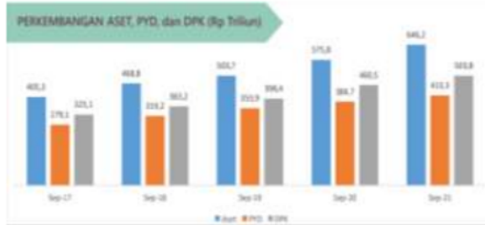
Gambar 1 Aset, PYD dan DPK 2017-2021

Berdasarkan gambar 1.1 terlihat tren yang positif dari perkembangan peningkatan aset, PYD dan DPK dari tahun 2017-2021. Hal ini menunjukkan tren yang cukup baik berkembangnya kinerja keuangan perbankan syariah di Indonesia yang terus mengalami peningkatan.