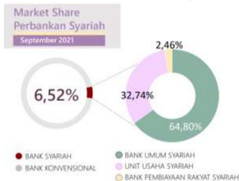
Gambar 2 Market Perbankan Syariah

Menurut data yang dikeluarkan (OJK, 2021), market share perbankan syariah di Indonesia pada September 2021 mencapai 6,52% dengan market share yang sebesar 6,52% artinya minat masyarakat Indonesia masih rendah dalam menggunakan bank syariah, padahal masyarakat Indonesia merupakan penduduk muslim terbesar di dunia berdasarkan data world population review pada tahun 2020 jumlah penduduk muslim di Tanah air mencapai 229 juta jiwa atau 87,2 % dari total penduduk 273,5 juta jiwa, hal ini menunjukkan peluang yang besar dalam mengembangkan perbankan syariah di Indonesia dapat dilihat dari luasnya segmen pasar yang ada.