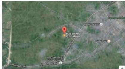
Gambar 2.2 : Citra Satelit Pondok Pesantren Darul Istiqamah