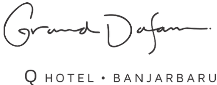
Gambar 4. 1 Logo Grand Dafam Q Hotel Banjarbaru

Grand Dafam Q Hotel Banjarbaru merupakan bagian dari Dafam Hotel Manajemen. Badan usaha yang bergerak dibidang hospitality yang terbentuk sejak tahun 2010. Hotel ini sudah tergabung dengan manajemen Hotel Dafam yang memiliki 27 hotel di 14 kota diseluruh Indonesia. Grand Dafam Q Hotel Banjarbaru merupakan hotel ke 13 yang beroperasi dibawah jaringan Dafam Hotel Management yang siap meramaikan bisnis perhotelan di Banjarmasin Kalimantan Selatan khususnya kota Banjarbaru. Hotel dengan konsep “Syariah” yang letaknya menyatu dengan Q Mall Banjarbaru, telah lebih dulu beroperasi ini menjadikannya “Strong Point” sebagai hotel yang tersambung langsung dengan pusat perbelanjaan termegah dan terlengkap di Banjarbaru.