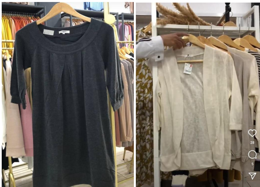
Pakaian bekas atau pakai mantan yang di jual di live sale pada instagram