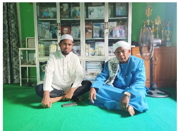
FOTO PENELITI BERSAMA