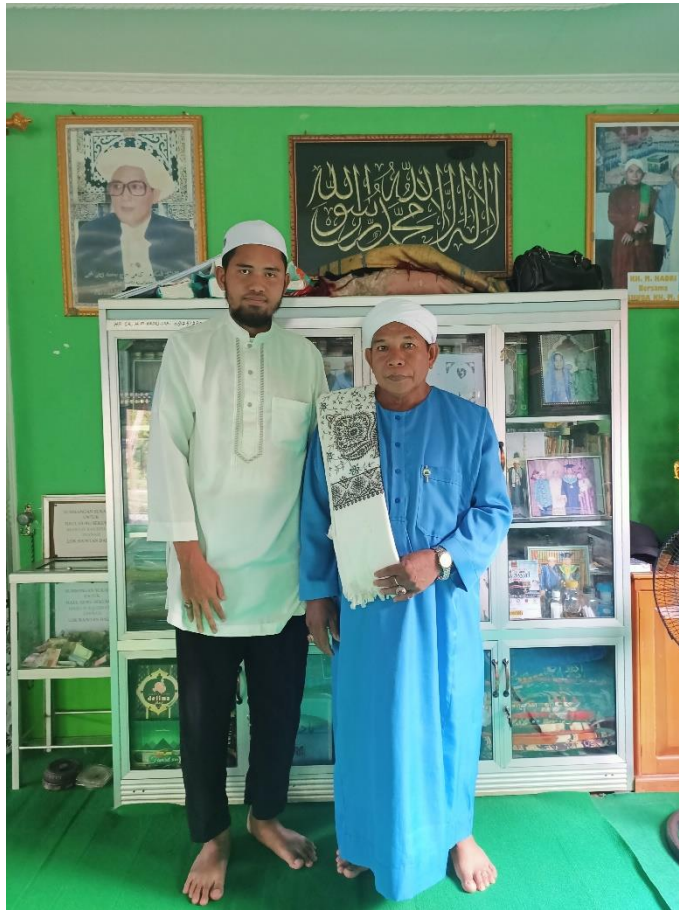
Foto-foto Peneliti dengan Responden Ketika Wawancara