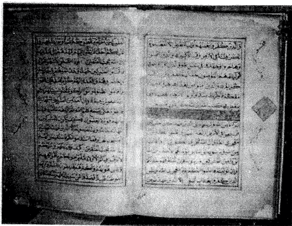
Surah at-Taubah, Juz 10. [Museum Banjarbaru, Banjarmasin]