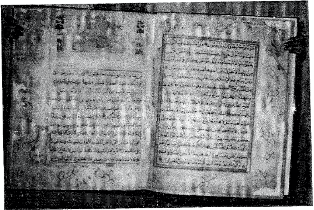
Mushaf al-Banjari, Juz 4, Surah Ali 'Imrān. [Museum Banjarbaru, Banjarmasin]

Banjari merupakan bukti penguasaan Syekh Muhammad Arsyad al-Banjari terhadap ilmu-ilmu al-Qur'an ( ulum al-Qur'an ), khususnya dalam bidang ilmu qiraat. 38