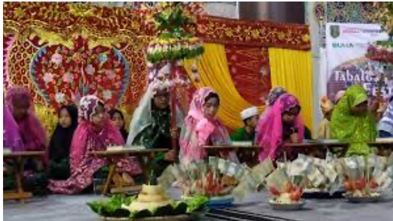
Gambar 1 Pelaksanaan Batamat Massal

serta koin sebagaimana keberangkatan. Mereka kemudian duduk di atas lapik yang telah disediakan di hadapan al-Qur'an yang terletak pada rehal atau batal (tempat meletakkan al-Qur'an). Di depan mereka biasanya diletakkan talam dan balai-balai berisi hidangan seperti gunung nasi ketan, wajik, telur rebus, dan hidangan lainnya. Payung dan kembang yang sebelumnya dibawa ditegakkan di belakang peserta. 63