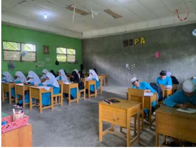
الصورة ٣؛ اختبار للصف الحادي عشر من العلوم الطبيعية

٢- البيانات أحوال طلبة بمدرسة باب السلام الثانوية الإسلامية المتكاملة بكوالا كافواس كاليمنتان الوسطى في السنة الدراسية ٢٠٢٢-٢٠٢٣ م