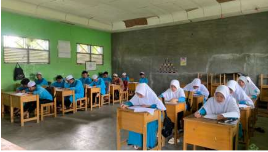
الصورة ١؛ اختبار للصف الحادي عشر من العلوم الاجتماعية