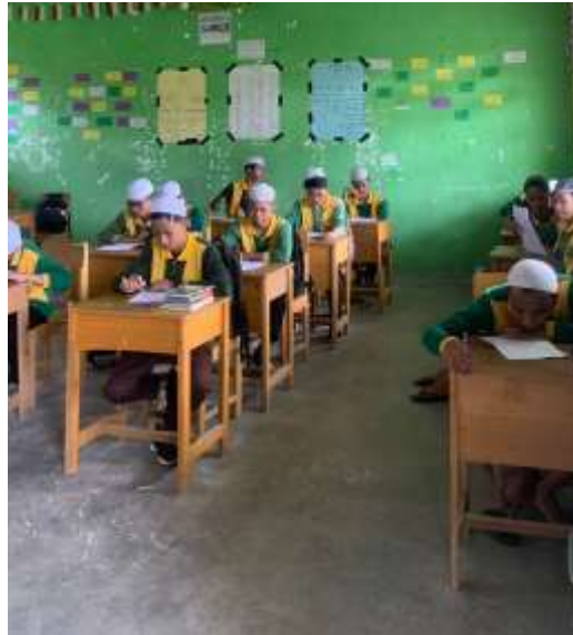
الصورة ٢؛ اختبار للصف الحادي عشر من الحادي عشر من اللغة