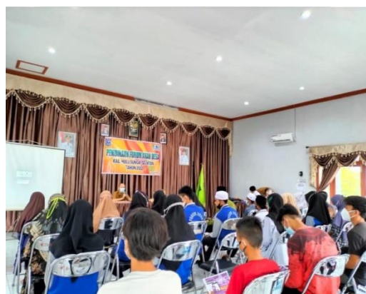
Gambar 4.5 Pembinaan forum anak

Berdasarkan gambar 4.4 di atas menunjukkan kegiatan bimbingan belajar bersama anak-anak tk. Sedangkan gambar 4.5 menunjukkan kegiatan pembinaan forum anak desa. Dan dari hasil wawancara di atas menunjukkan bahwa Dinas Perpustakaan dan Kearsipan Kabupaten Hulu Sungai Selatan telah melaksanakan berbagai macam kegiatan pada bulan Mei dan Juni diantara kegiatannya: pelatihan membuat katalog, bimbingan belajar bersama anak tk, pembinaan forum anak desa, dan road show sosialisasi minat baca.