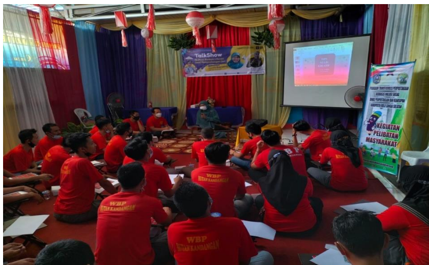
Gambar 4.8 Menulis kreatif bersama warga binaan rutan Kandangan

Oktober, kegiatan bimbingan belajar kepada siswa kelas 4 MIN 18 Hulu Sungai Selatan yang diikuti 18 peserta. Kegiatan vaksinasi rabies dan emberian vitamin gratis yang diikuti sebanyak 25 peserta, pada kegiatan ini bekerja sama dengan Dinas Pertanian dan Perikanan Hulu Sungai Selatan. Kegiatan menulis kreatif bersama anak sekolah yang diikuti sebanyak 40 peserta, kegiatan ini bekerja sama dengan penulis Eva Liana. Dan yang terakhir kegiatan pelatihan tata rias yang diikuti 10 peserta kegiatan ini bekerja sama dengan Tiara Kosmetik Kandangan.