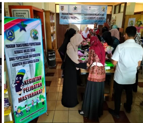
Gambar 4.10 Pelatihan tata boga

Berdasarkan gambar 4.9 di atas menunjukkan kegiatan penyuluhan pencegahan kekerasan terhadap anak. Sedangkan gambar 4.10 menunjukkan kegiatan pelatihan tata boga bersama masyarakat. Dan dari hasil wawancara di atas menunjukkan bahwa Dinas Perpustakaan dan Kearsipan Kabupaten Hulu Sungai Selatan telah melaksanakan berbagai macam kegiatan pada bulan November dan