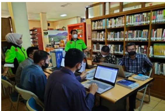
Gambar 4.2 pelatihan microsoft office

April, kegiatan pelatihan kreasi tepat guna membuat konektor masker bersama masyarakat diikuti sebanyak 15 peserta. Pada kegiatan ini Dinas Perpustakaan dan Informasi Islam bekerja sama dengan Fathiya Olshop Kandangan. Kemudian pelatihan pengolahan bahan pustakan bersama mahasiswa dari Universitas Terbuka Banjarmasin yang diikuti sebanyak 3 peserta. Pelatihan membuat snack bucket bersama masyarakat yang diikuti sebanyak 10 peserta, kegiatan ini bekerja sama dengan Bank Kalsel Syariah. Kegiatan sosialisasi sistem keuangan syariah bersama masyarakat yang diikuti sebanyak 20 peserta, kegiatan ini bekerja sama dengan Bank Kalsel Syariah.