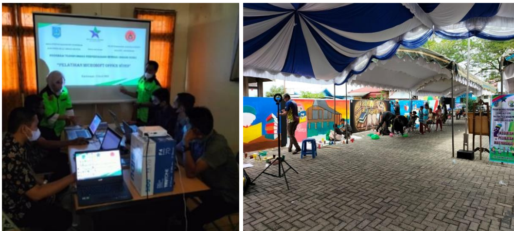
Gambar 4.6 Pelatihan ms power point Gambar 4.7 Lomba melukis dinding mural

Agustus, kegiatan pelatihan microsoft office power point yang diikuti 5 peserta, kegiatan ini bekerja sama dengan PKBM (Pusat Kegiatan Belajar Masyarakat) Amandit. Kegiatan pembinaan perpustakaan Kabupaten/Kota yang diikuti sebanyak 50 peserta, pada kegiatan kali ini Dinas Perpustakaan dan Kearsipan Kabupaten Hulu Sungai Selatan bekerja sama dengan Dinas Perpustakaan dan Kearsipan Provinsi Kalimantan Selatan. Kegiatan bimbingan belajar kepada siswa SDN Kandungan Kota 1 yang diikuti 9 peserta. Dan kegiatan bimbingan belajar kepada siswa SDN Sungai Mandala yang diikuti 6 peserta.