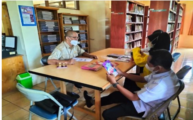
Gambar 4.1 penambahan koleksi perpustakaan

Berdasarkan gambar 4.1 dan hasil wawancara di atas menunjukkan bahwa Dinas Perpustakaan dan Kearsipan Kabupaten Hulu Sungai Selatan telah melakukan strategi peningkatan layanan melalui penambahan beberapa koleksi cetak, koleksi digital dan komputer untuk meningkatkan pelayanan pada perpustakaan dari segi sarana dan prasarana.