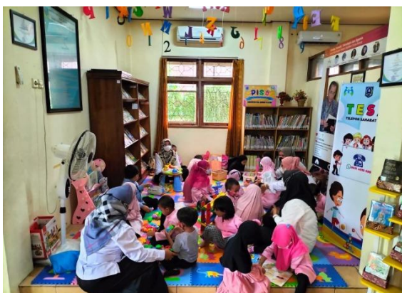
Gambar 4.4 Bimbingan belajar anak tk

Juni, Kegiatan pembuatan video tugas kuliah tentang serunya di perpustakaan bersama mahasiswa STAI Darul Ulum Kandangan yang diikuti 4 peserta. Kegiatan belajar mengenal karya sastra bersama MTsN 1 Hulu Sungai Selatan yang diikuti 12 peserta. Kegiatan pembinaan forum anak desa Kecamatan Daha Utara yang diikuti 33 peserta, kegiatan kali ini bekerja sama dengan Dinas PPKB PPPA (Pengendalian Penduduk Keluarga Berencana Pemberdayaan Perempuan Perlindungan Anak). Kegiatan belajar mengenal karya fiksi bersama MI Taniran yang diikuti 42 peserta. Kegiatan road show sosialisasi minat baca bersama masyarakat yang diikuti sebanyak 100 peserta, pada kegiatan kali ini Dinas Perpustakaan dan Kearsipan Kabupaten Hulu Sungai Selatan bekerja sama dengan Dinas Perpustakaan dan Kearsipan Provinsi Kalimantan Selatan.