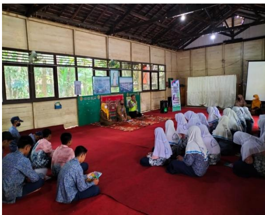
Gambar 4.9 Kegiatan Penyuluhan

Dan yang terakhir pada bulan Desember, kegiatan yang dilakukan yaitu pelatihan microsoft office word yang diikuti 5 peserta, kegiatan ini bekerja sama dengan PKBM (Pusat Kegiatan Belajar Masyarakat) Amandit. Dan kegiatan penyuluhan pencegahan kekerasan terhadap anak yang diikuti sebanyak 20 peserta, kegiatan ini bekerja sama dengan Dinas PPKB PPPA ( Pengendalian Penduduk Keluarga Berencana Pemberdayaan Perempuan Perlindungan Anak)”.