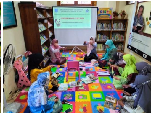
Gambar 4.3 Pelatihan kreasi tepatguna

Berdasarkan gambar 4.2 di atas menunjukkan kegiatan pelatihan komputer, microsoft office. Sedangkan gambar 4.3 di atas menunjukkan kegiatan pelatihan kreasi tepat guna bersama masyarakat. Dan dari hasil wawancara di atas menunjukkan bahwa Dinas Perpustakaan dan Kearsipan Kabupaten Hulu Sungai Selatan telah melaksanakan berbagai macam kegiatan pada bulan Maret dan April diantara kegiatannya: pelatihan komputer microsoft office, bimbingan belajar, dan pelatihan kreasi tepat guna.