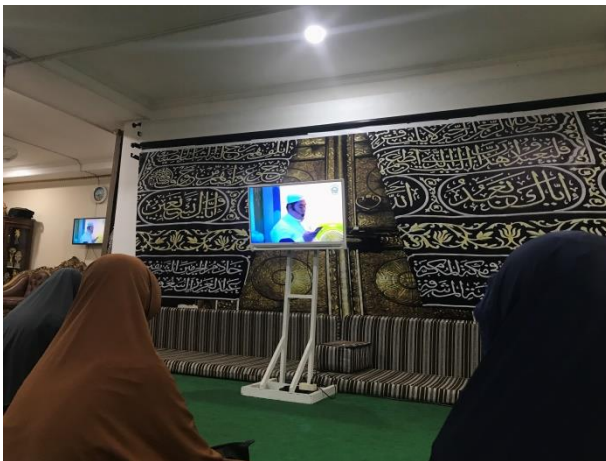
Foto Bersama Pimpinan Majelis Taklim As-Shofa