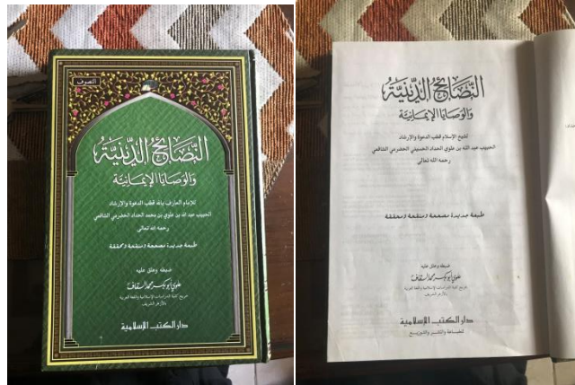
Gambar 4.8 Kitab Nashoihud Diniyyah

dengan pembacaan kitab. Kitab yang saat ini digunakan yaitu kitab Nashoihud Diniyyah . 73