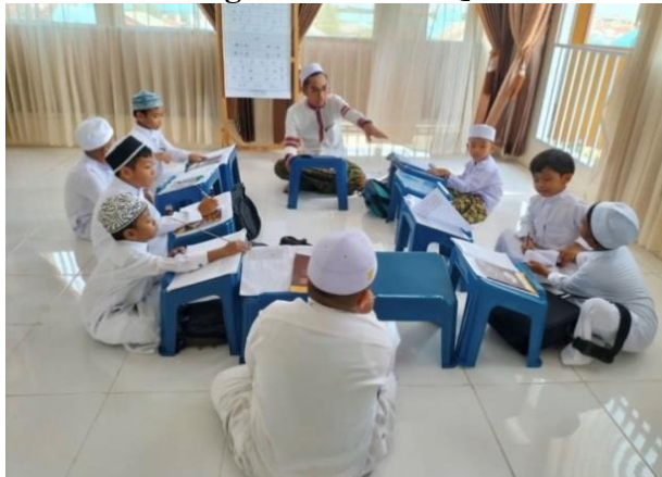
Gambar 4.21 Kegiatan Rumah Qur'an As-Shofa