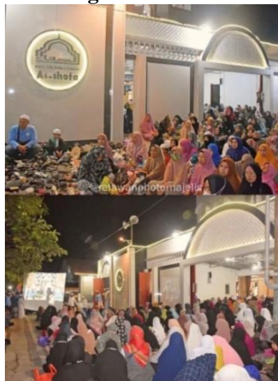
Gambar 4.19 Kegiatan Haul Guru Sekumpul