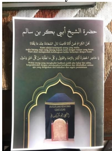
Gambar 4.13 Kitab Hadrah Syekh Abu Bakar bin Salim