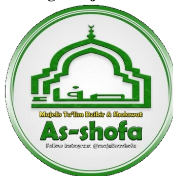
Gambar 4.2 Logo Majelis Taklim As-Shofa