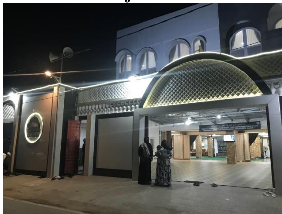
Gambar 4.1 Majelis Taklim As-Shofa