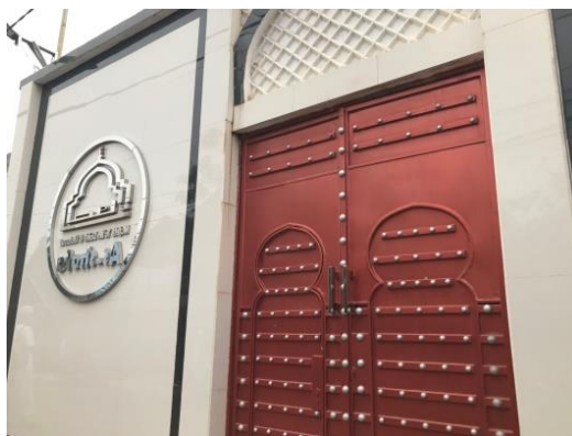
Gambar 4.3 Logo Majelis Taklim As-Shofa