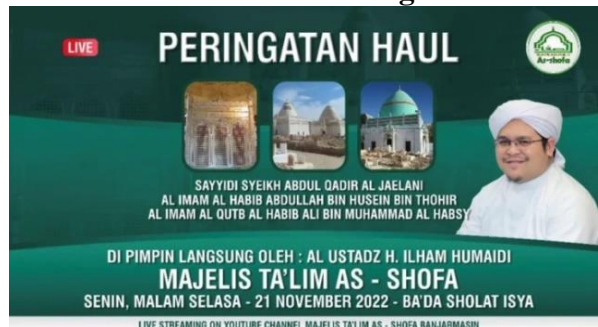
Gambar 4.18 Pamflet Undangan Acara Haul