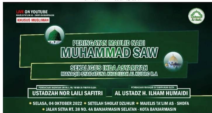
Gambar 4.17 Pamflet Undangan Peringatan Maulid Nabi Muhammad Saw