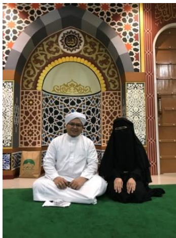
Gambar 4.7 Foto Bersama dengan Pimpinan Majelis Taklim As-Shofa