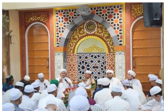
Gambar 4.6 Kedatangan Tamu Mulia