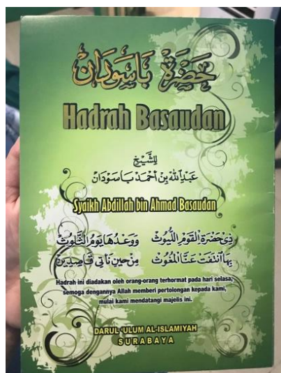
Gambar 4.16 Buku Hadrah Basaudan

ini dimulai dengan pembacaan Hadrah Basaudan yang dipimpin oleh Ustadzah Nor Laili Safitri yang kemudian disambung pembacaan ceramah agama yang juga dipimpin oleh beliau. Buku yang digunakan yakni Buku Hadrah Basaudan karangan Syaikh Abdillah bin Ahmad Basaudan.