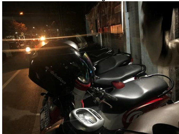
Gambar 4.10 Parkiran Majelis Taklim As-Shofa

papan petunjuk arah parkir yang bertujuan untuk memudahkan para jemaah dalam meletakkan kendaraan sehingga dapat tersusun rapi dan mengurangi kemacetan lalu lintas. Petugas yang berada pada bidang tersebut sudah di bagi ke beberapa titik parkir sekitar lokasi majelis ada yang bertugas pada parkir mobil dan ada yang bertugas pada parkir kendaraan. Setelah acara selesai para pengurus bidang parkir mengatur kembali jalan saat jemaah pulang agar tidak terjadi kemacetan.