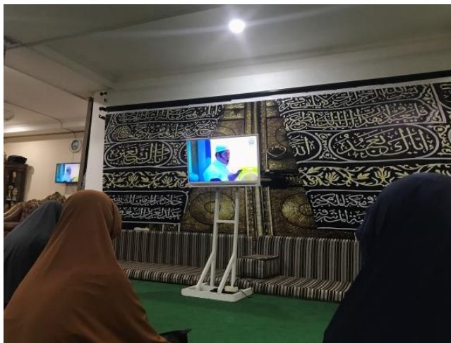
Gambar 4. 22 TV Kecil

Berdasarkan hasil observasi, pada saat kegiatan pengajian rutin malam selasa berlangsung para pengurus hanya menyiapkan beberapa tv kecil di lantai satu dan tiga sehingga membuat jemaah yang jaraknya lumayan jauh dengan tv kecil, akan kesusahan melihat pengajian tersebut. Tetapi hal tersebut tidak menimbulkan permasalahan yang serius karena didukung dengan sound system yang jernih membuat jemaah merasa tetap nyaman saat pengajian berlangsung.