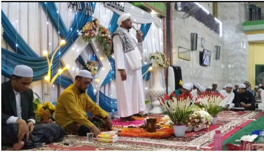
Gambar 3.1 (Ceramah Keagamaan di Masjid Jami Teluk Dalam)