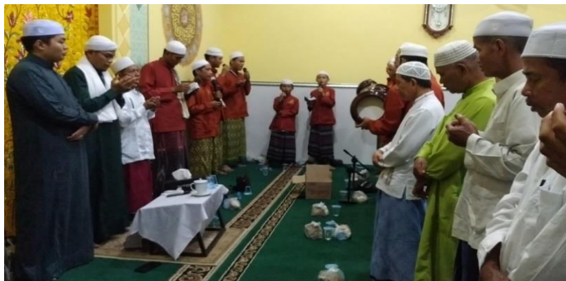
Gambar 1.2 (Kegiatan Mahallul Qiyam di Musholla Nurul Hidayah)