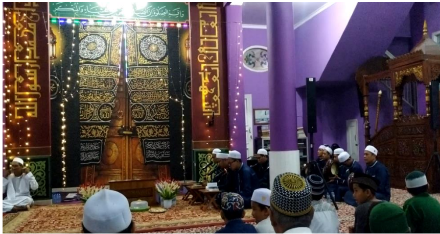
Gambar 4.1 (Kelompok Penyair & Pemukul Rebana di Masjid Al-Khair)