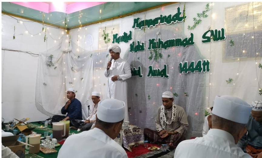
Gambar 3.3 (Ceramah Keagamaan di Musholla Darul Aman)