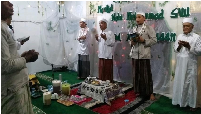
Gambar 1.1 (Kegiatan Mahallul Qiyam di Musholla Darul Aman)