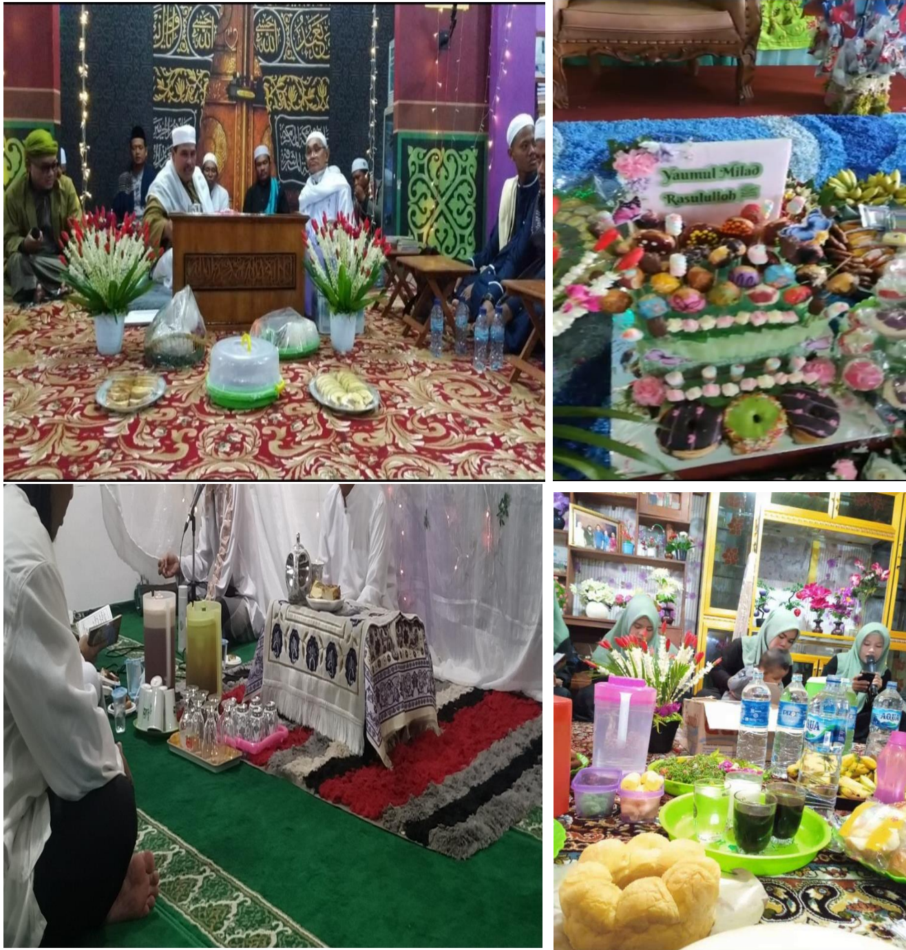
Gambar 2.1 (Peletakan Hidangan di Tengah Tempat berlangsungnya Maulid Nabi)