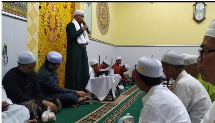
Gambar 3.2 (Ceramah Keagamaan di Musholla Nurul Hidayah)