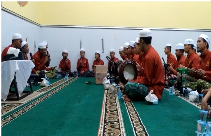
Gambar 4.2 (Kelompok Penyair & Pemukul Rebana di Musholla Nurul Hidayah)