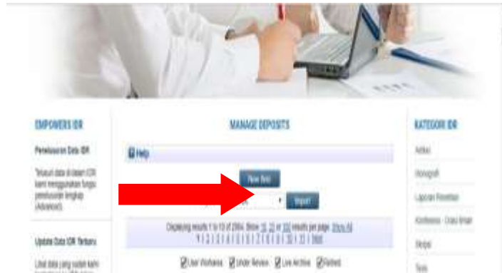
Gambar 4.5 Penginputan koleksi digital