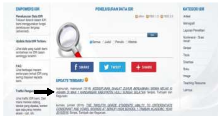
Gambar 4.10 Penginputan koleksi digital