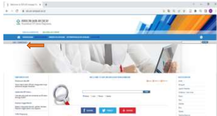
Gambar 4.1 Penginputan koleksi digital

Isi formulir dengan nama (sesuai identitas), email (email yang aktif dan bisa dibuka), username dan password yang sesuai keinginan. Apabila nama hanya satu kata, nama bisa diulang sehingga semua kolom nama terisi. Ketika mengisi email, pastikan email tersebut aktif dan bisa dibuka. Jangan isi dengan alamat email yang password email tersebut lupa. Setelah selesai mengisi, klik register .