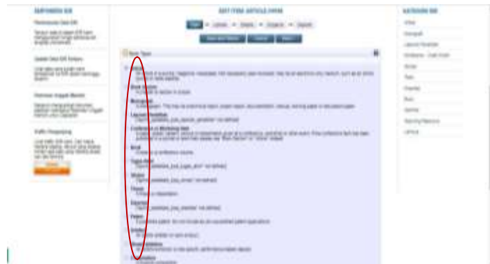
Gambar 4.6 Penginputan koleksi digital