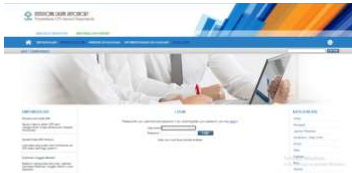
Gambar 4.4 Penginputan koleksi digital