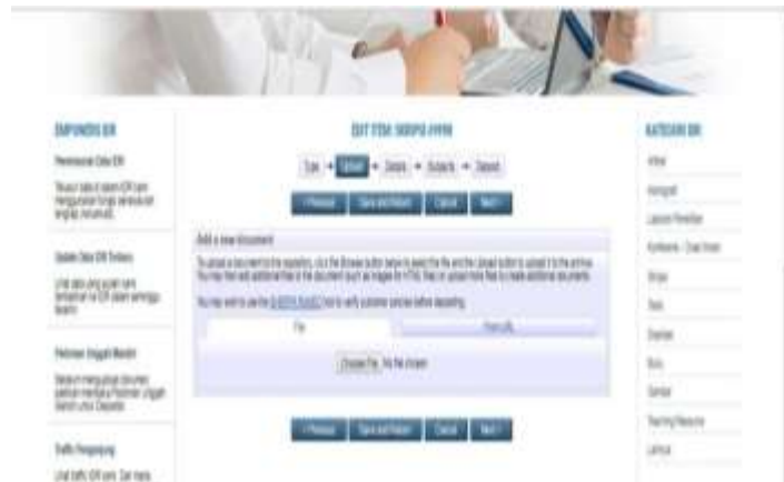
Gambar 4.7 Penginputan koleksi digital

File yang diunggah adalah seluruh skripsi atau tugas akhir lain dibuat dalam format PDF dengan dibagi menjadi beberapa file dan diberi nama sebagai berikut: