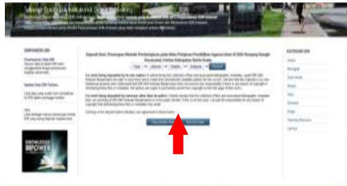
Gambar 4.12 Penginputan koleksi digital