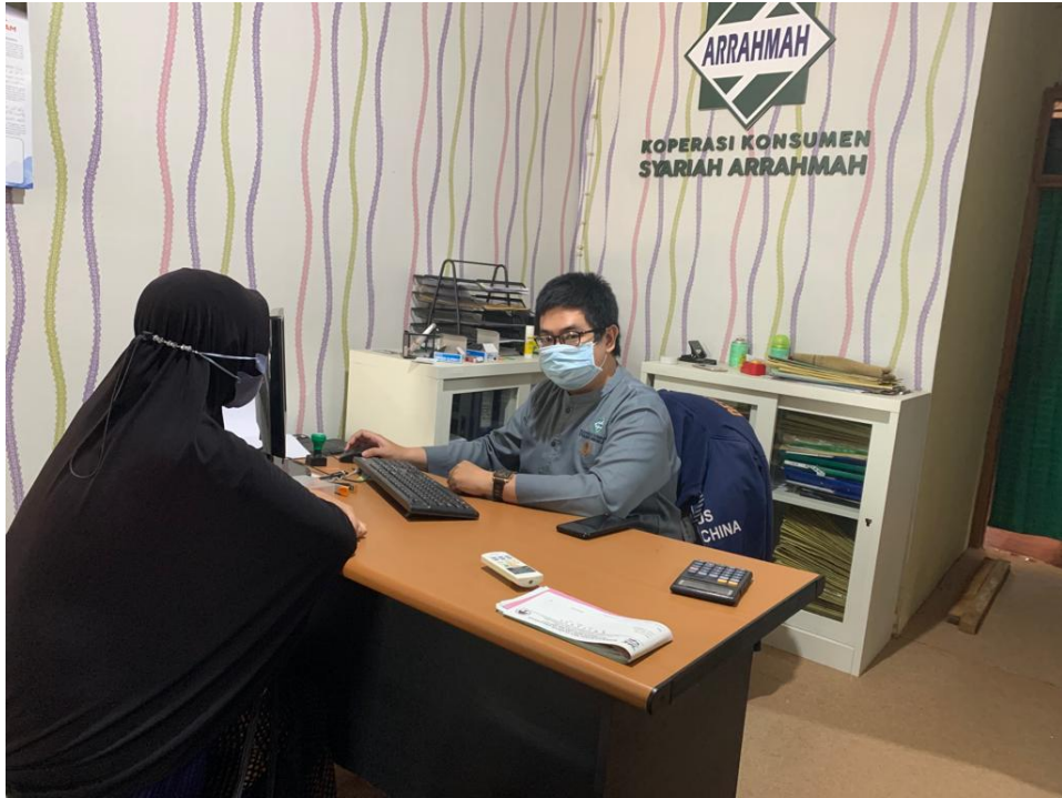
Anggota nasabah yang berkunjung ke Koperasi Syariah Arrahmah Banjarmasin dan dilayani oleh CS