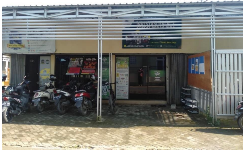
Lokasi Koperasi Syariah Arrahmah Banjarmasin