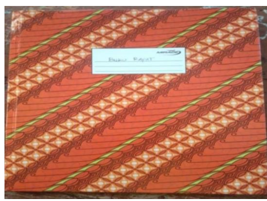
Gambar 4.1 Buku Absen dan daftar hadir rapat pembagian tugas tahun ajaran 2022/2023 MTs Ulumul Qur'an