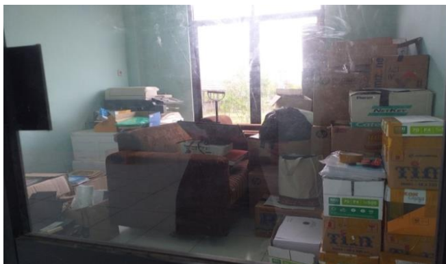
Gambar 4.3 tempat penyimpanan dan gudang MTs Ulumul Qur'an Barito Kuala