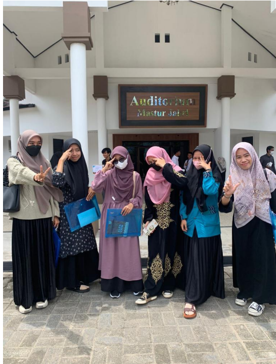
Gambar 1. Gaya Berpakaian 1