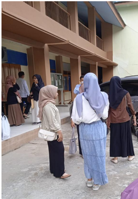
Gambar 4. Gaya Berpakaian 4