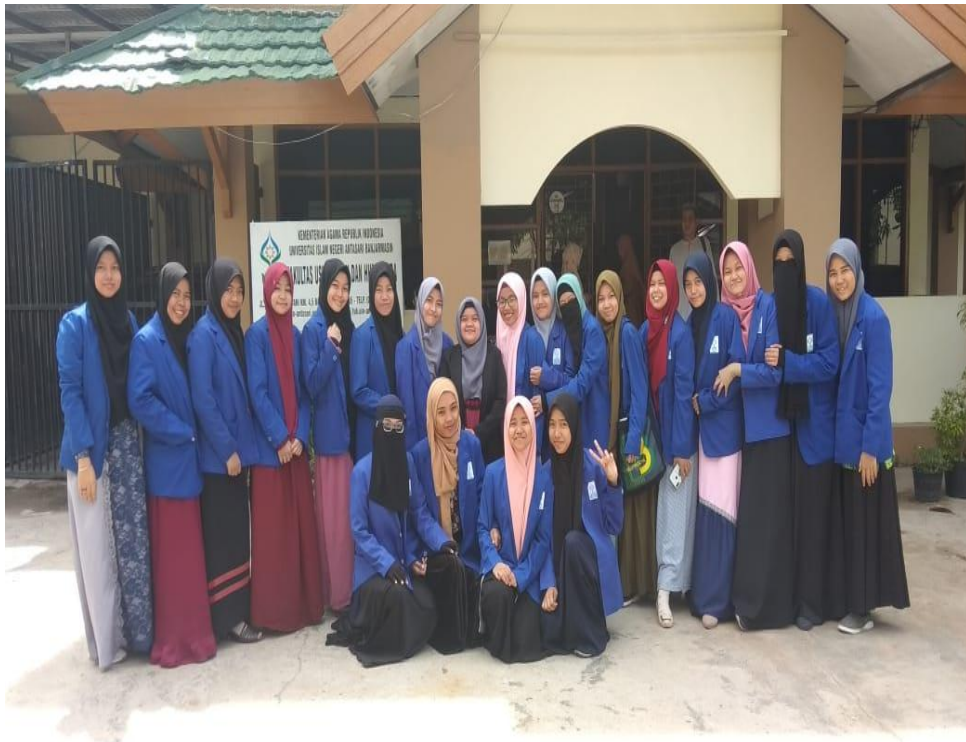
Gambar 26. Syar'i Style 6