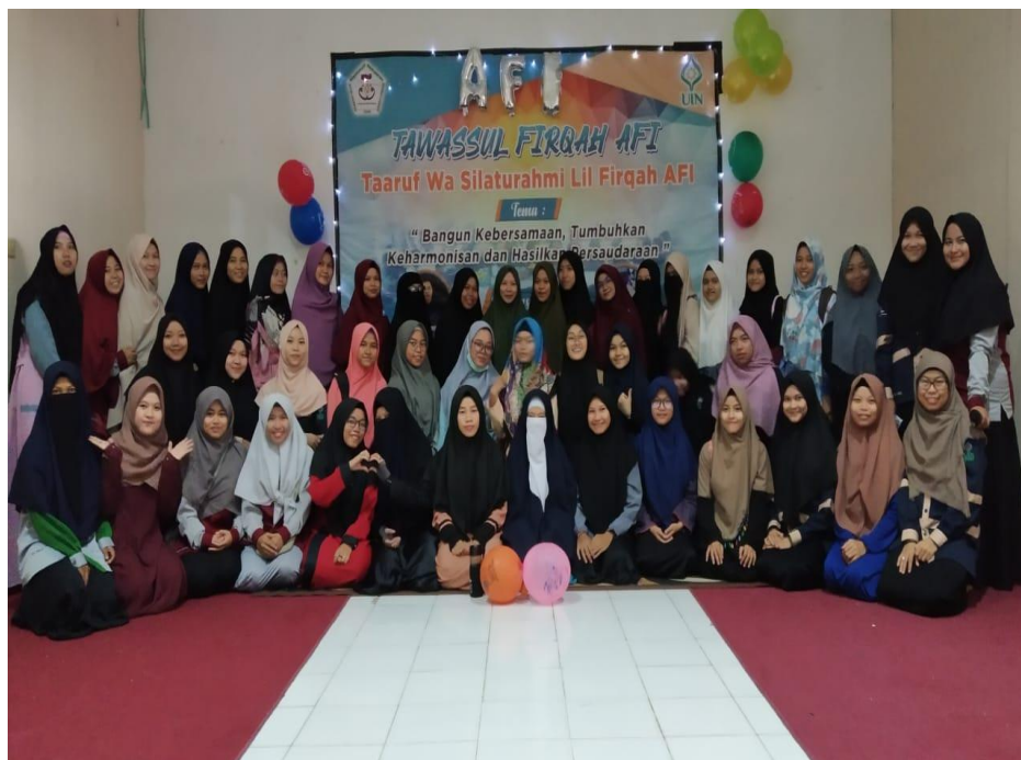
Gambar 11. Gaya Berpakaian 11