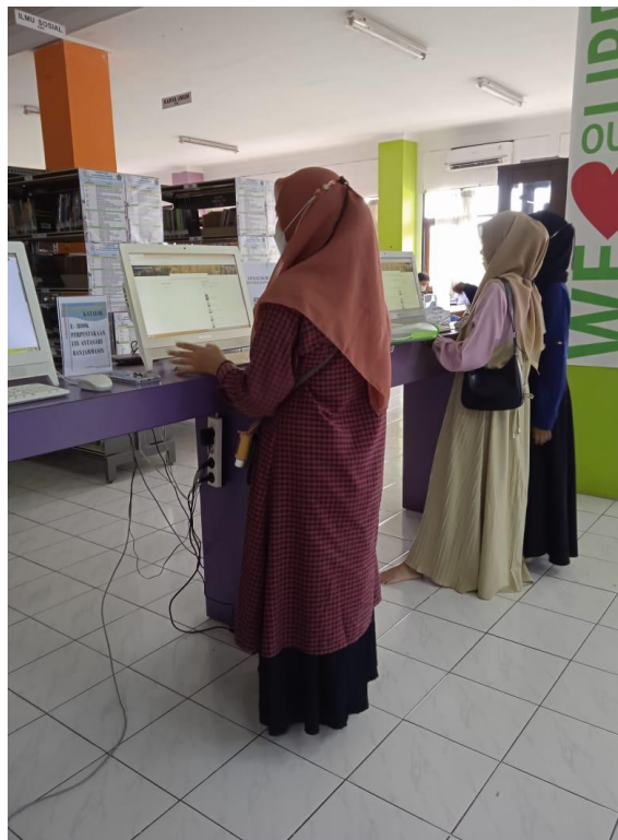
Gambar 6. Gaya Berpakaian 6