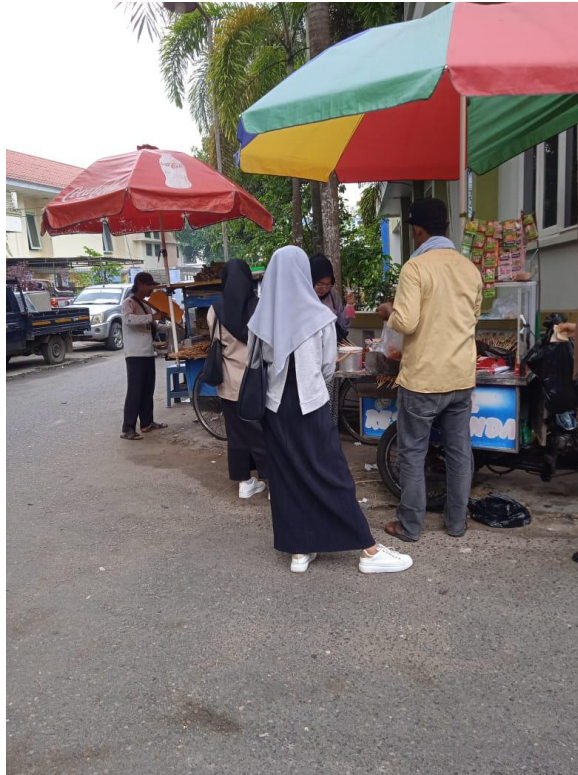
Gambar 19. Casual Style 9