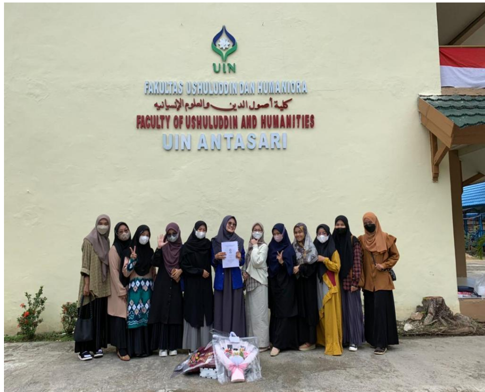
Gambar 8. Gaya Berpakaian 8