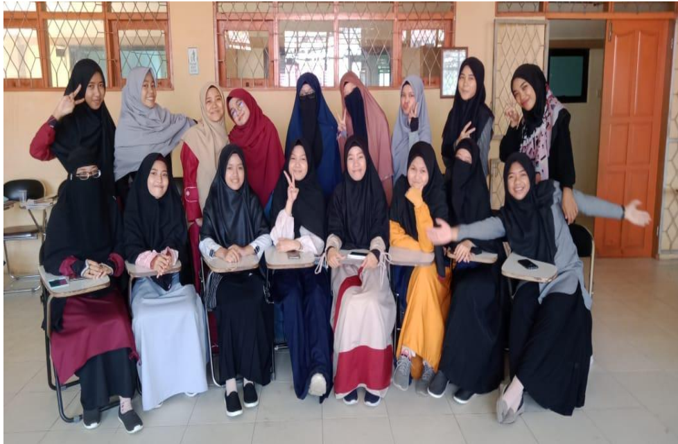
Gambar 25. Syar'i Style 5