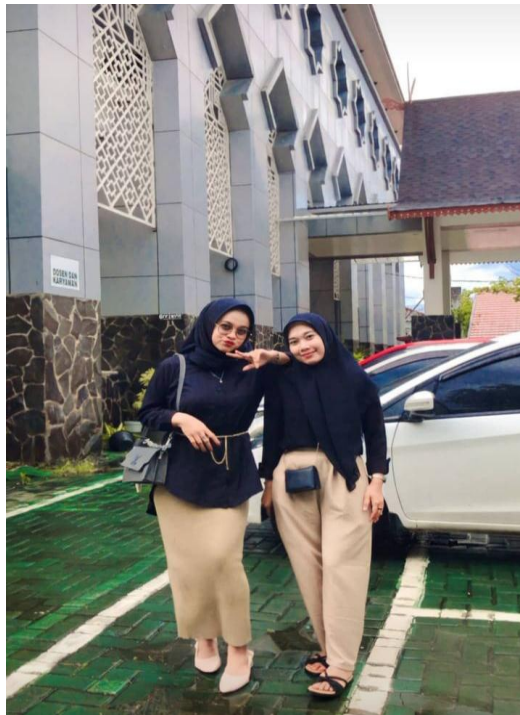
Gambar 8. Preppy Style 1