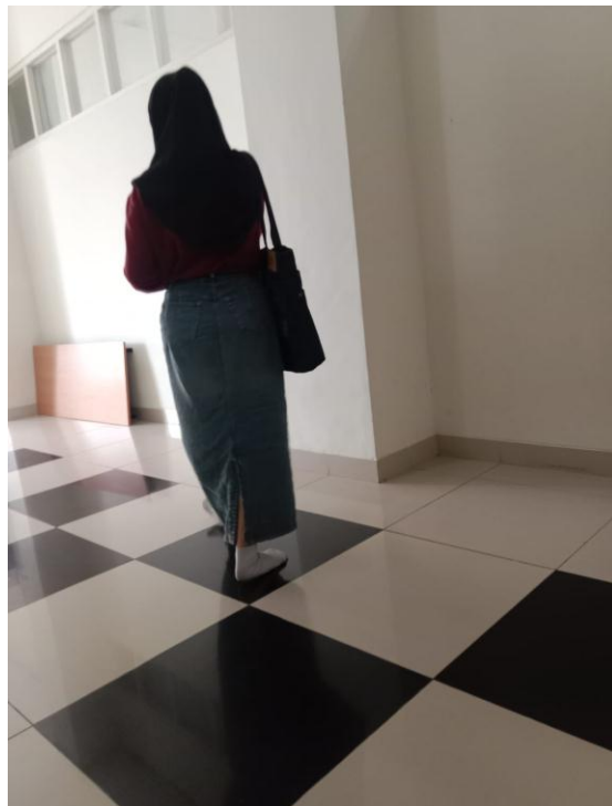
Gambar 6. Vintage Style 2