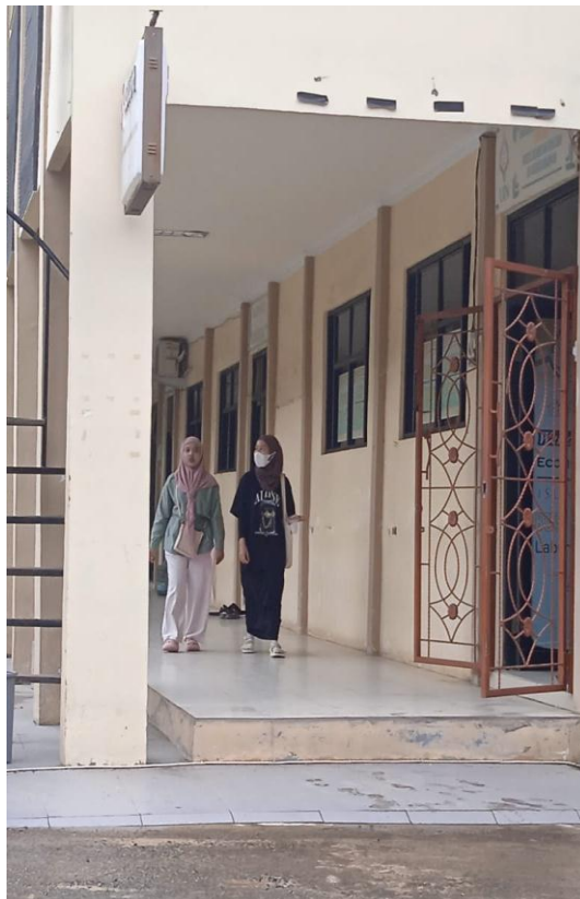
Gambar 12. Casual Style 2