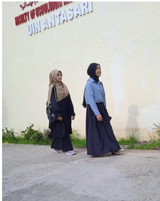
Gambar 3. Gaya Berpakaian 3