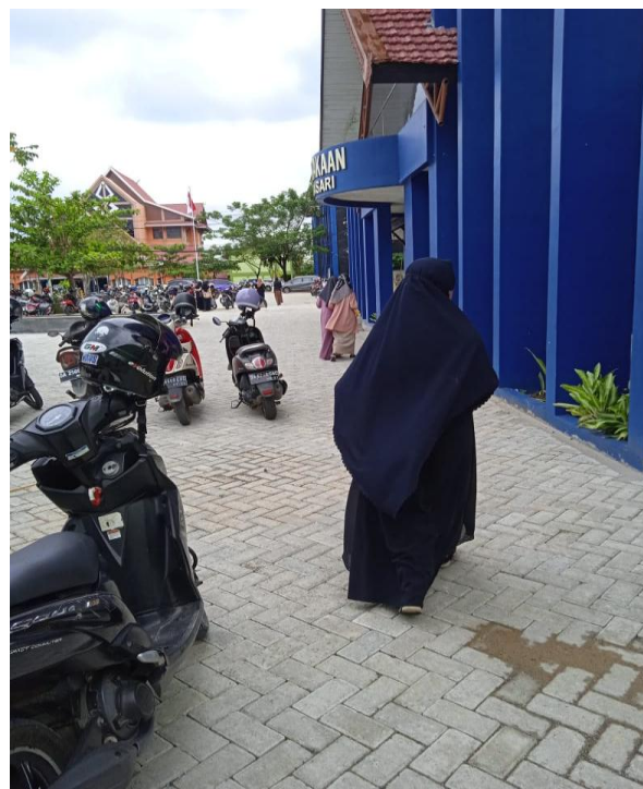
Gambar 22. Syar'i Style 2