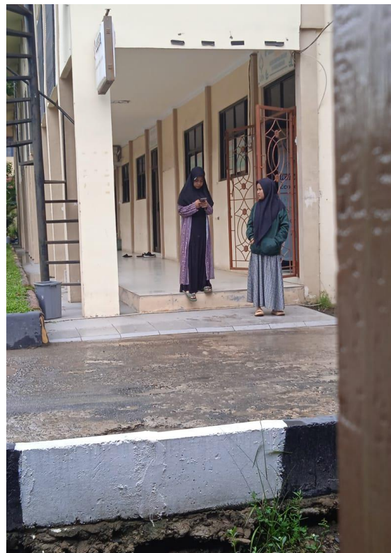
Gambar 16. Casual Style 6