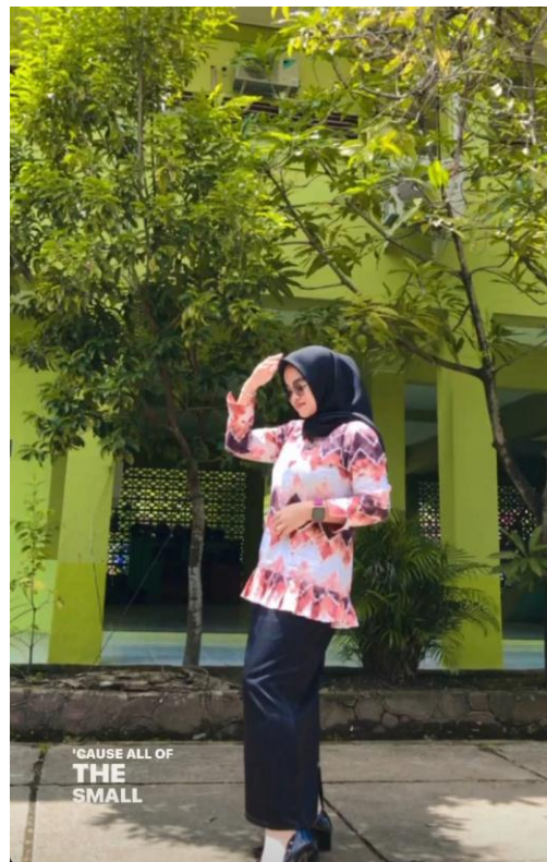
Gambar 10. Preppy Style 3