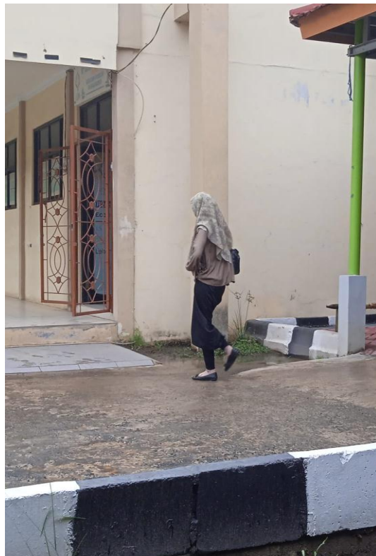
Gambar 14. Casual Style 4