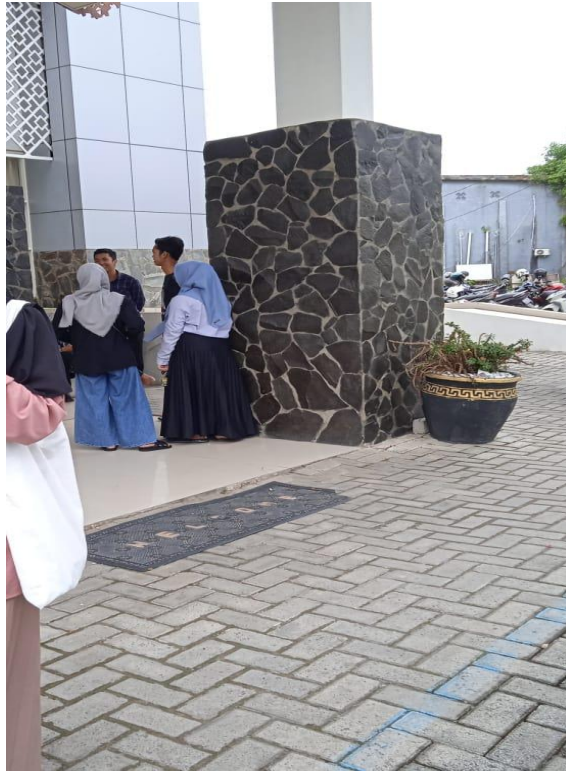
Gambar 5. Gaya Berpakaian 5