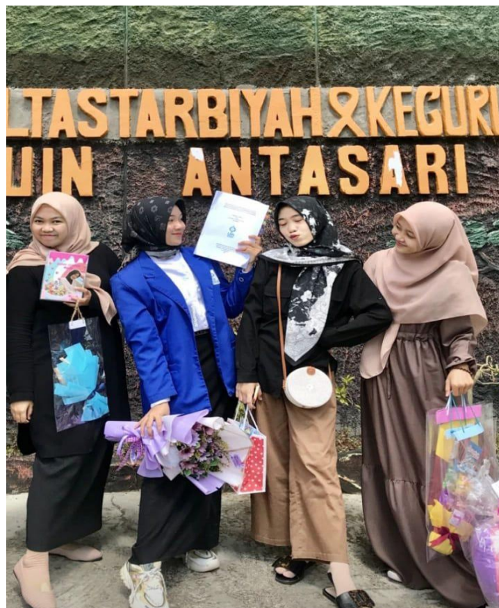
Gambar 13. Gaya Berpakaian 13