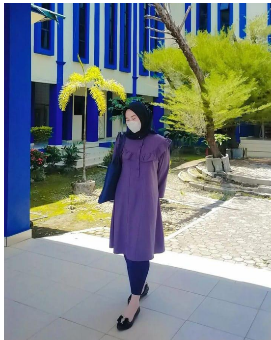
Gambar 2. Korean Style 2