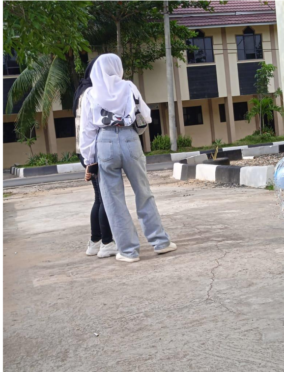
Gambar 5. Vintage Style 1