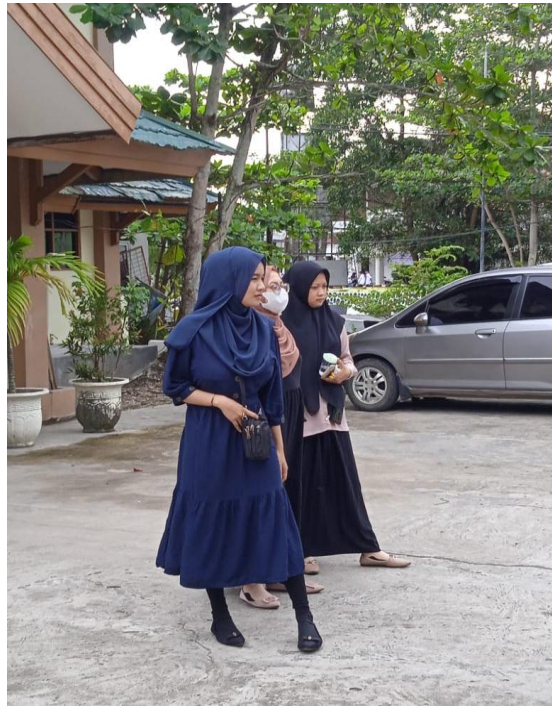
Gambar 1. Korean Style 1