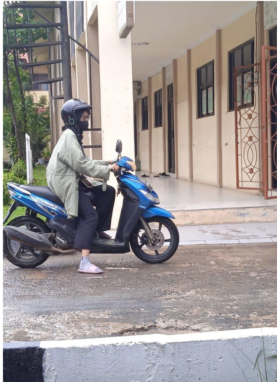
Gambar 15. Casual Style 5