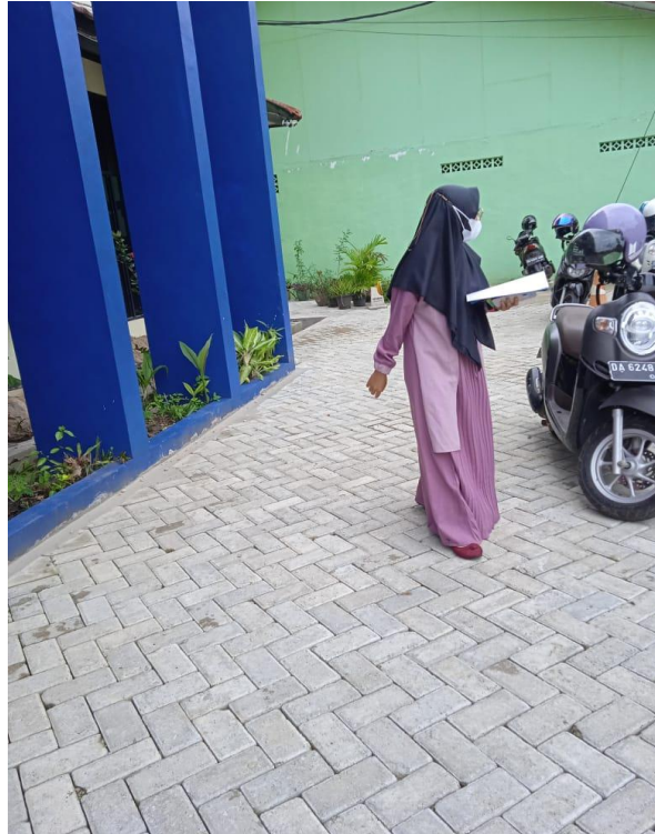
Gambar 21. Syar'i Style 1