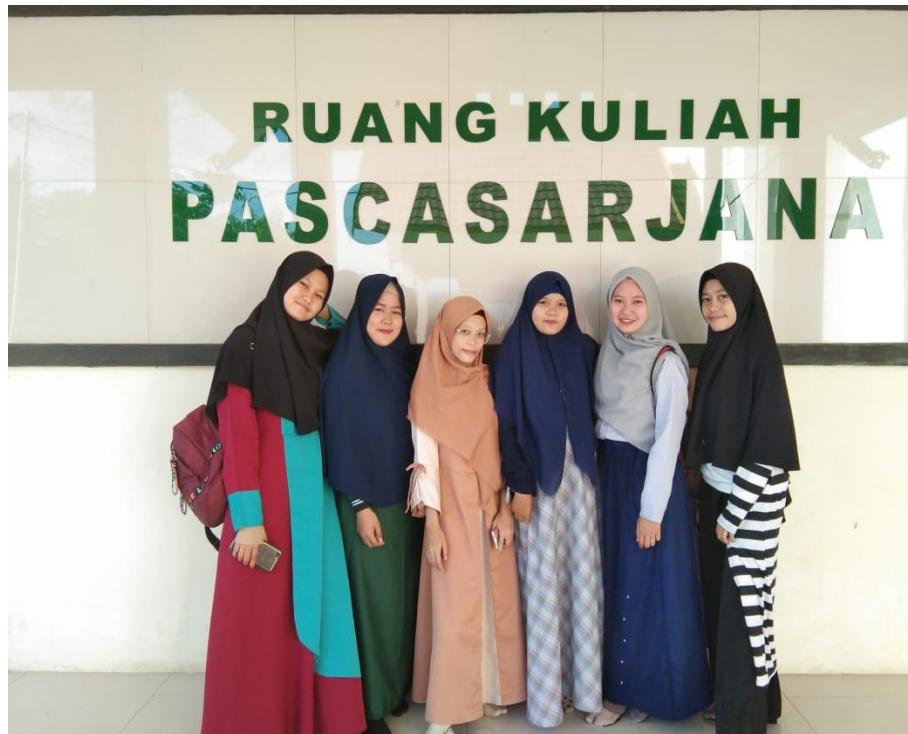
Gambar 10. Gaya Berpakaian 10