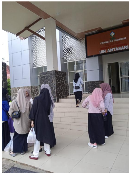
Gambar 2. Gaya Berpakaian 2