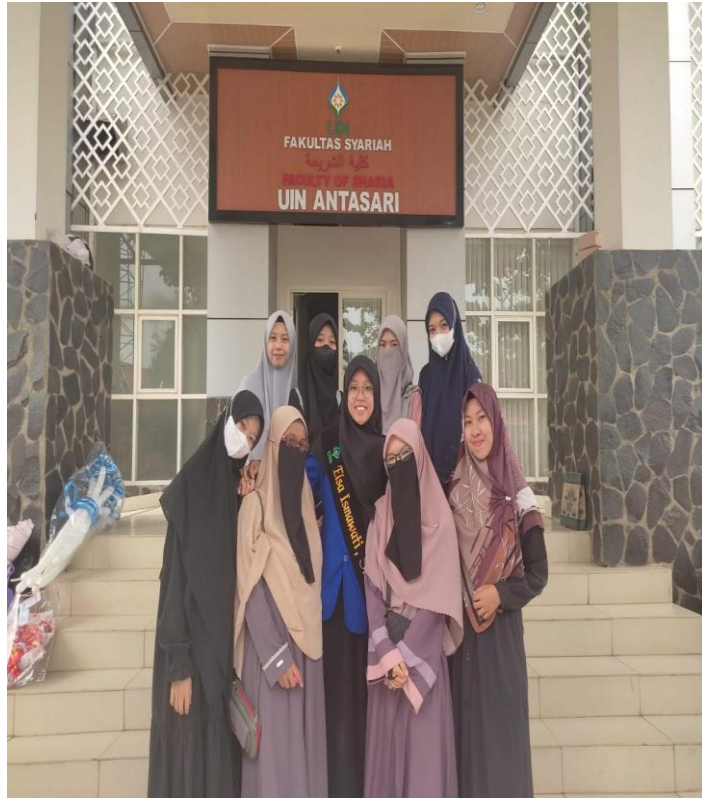
Gambar 23. Syar'i Style 3