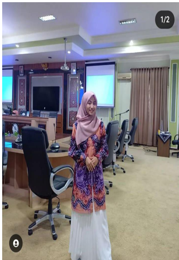
Gambar 20. Casual Style 10