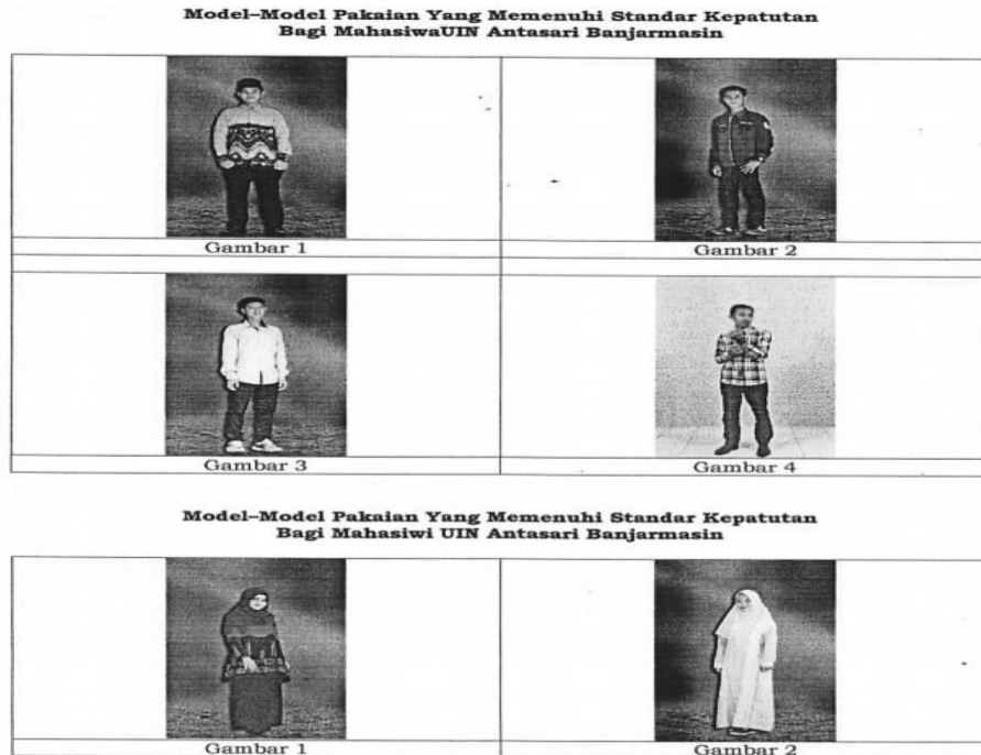
Gambar 1. Gaya Berpakaian yang Benar