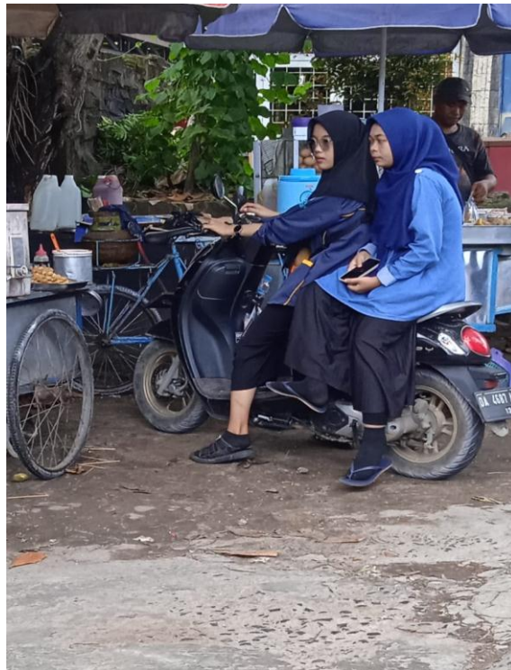
Gambar 18. Casual Style 8