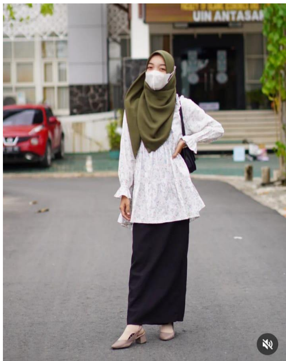
Gambar 4. Korean Style 4