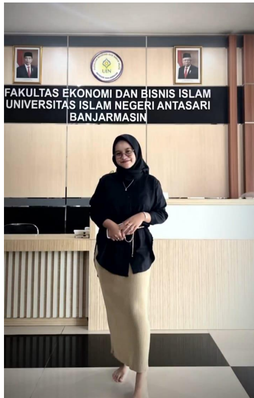
Gambar 9. Preppy Style 2