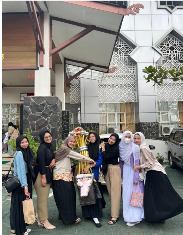
Gambar 7. Gaya Berpakaian 7