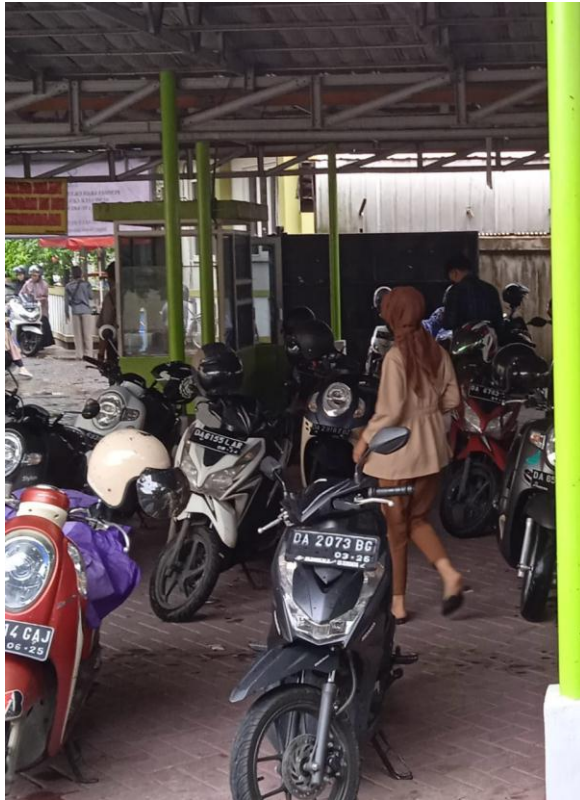
Gambar 17. Casual Style 7