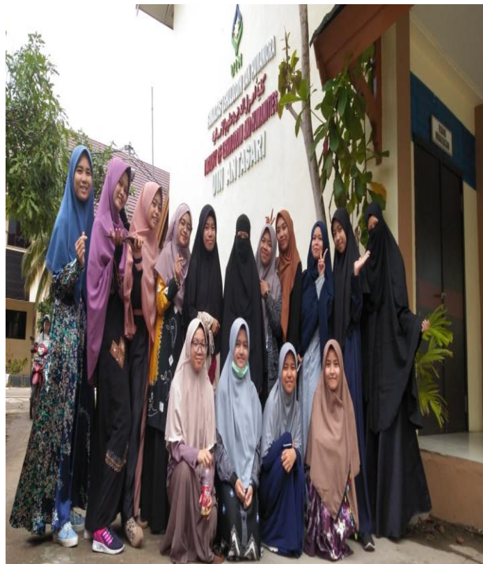
Gambar 24. Syar'i Style 4