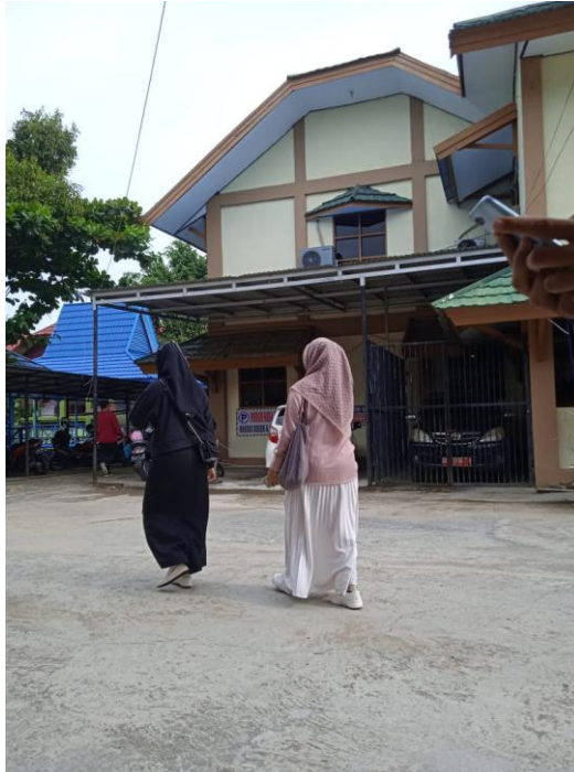
Gambar 11. Casual Style 1