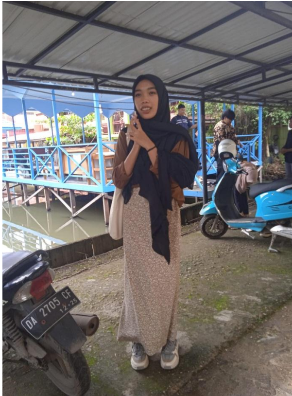
Gambar 3. Korean Style 3