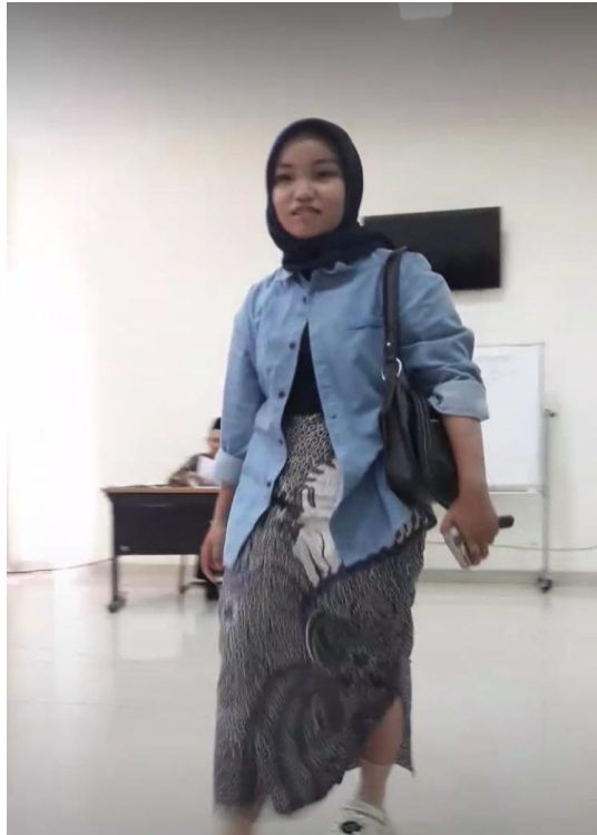
Gambar 7. Vintage Style 3