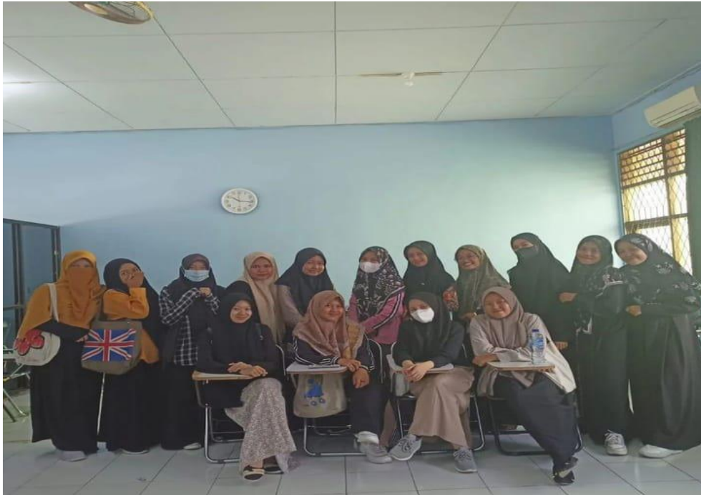
Gambar 12. Gaya Berpakaian 12