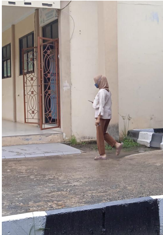
Gambar 13. Casual Style 3