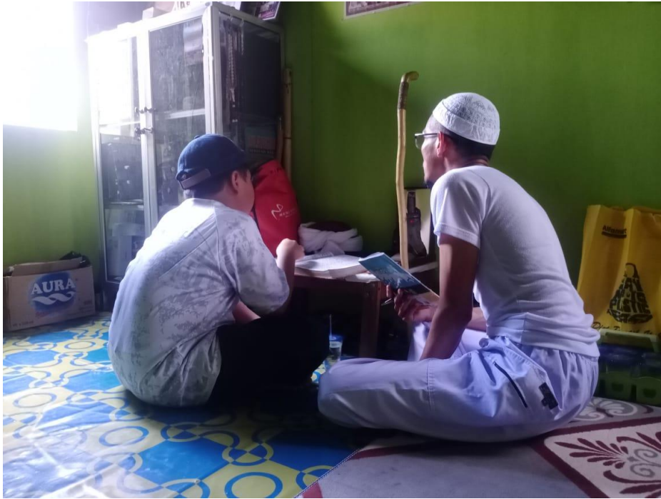
Foto Bimbingan Membaca Al-Qur'an dan Tajwid