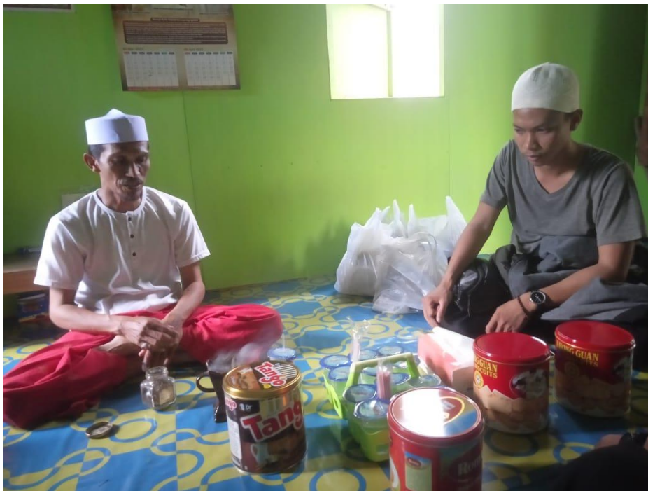
Foto Bimbingan Nasehat