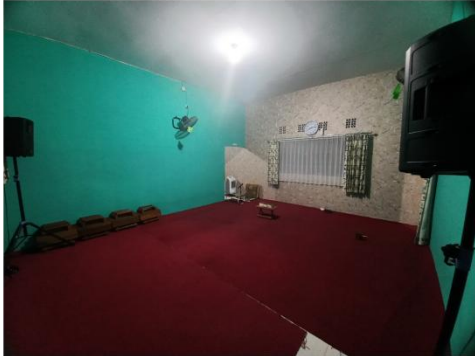
Ruang kelas laki-laki