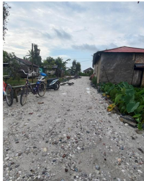
Halaman Rumah Al-Qur'an Al-Ikhlas