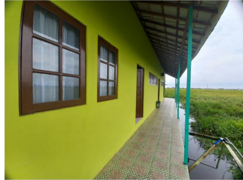
Rumah Al-Qur'an Al-Ikhlas tampak samping