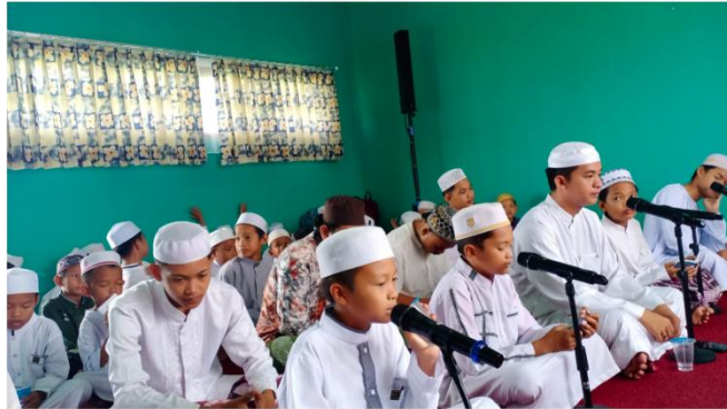
Pembacaan Simthu' ad-Durar