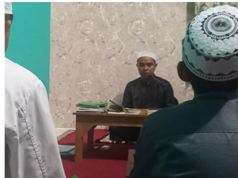
Kegiatan Tahsin Al-Fatihah