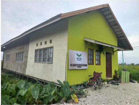
Rumah Al-Qur'an Al-Ikhlas tampak depan