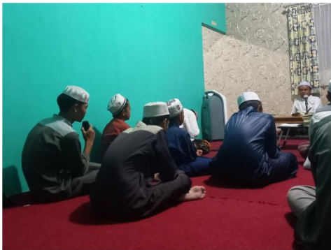
Kegiatan Tahsin Al-Fatihah