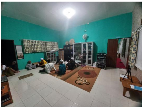
Ruangan kantor/ Ruang guru