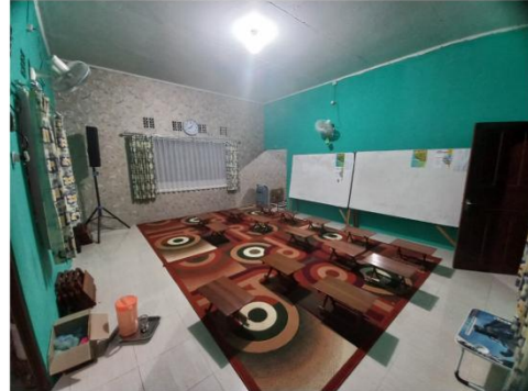
Ruang kelas perempuan