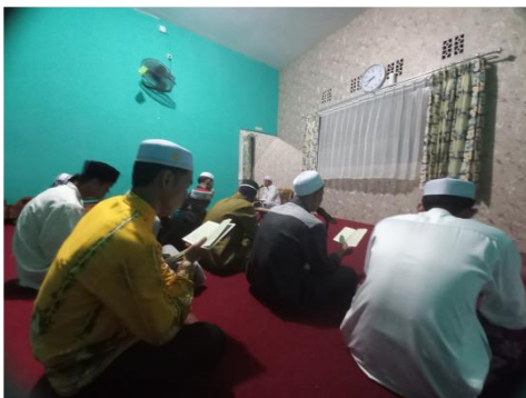
Kegiatan Pembacaan Dala'il al-Khairat