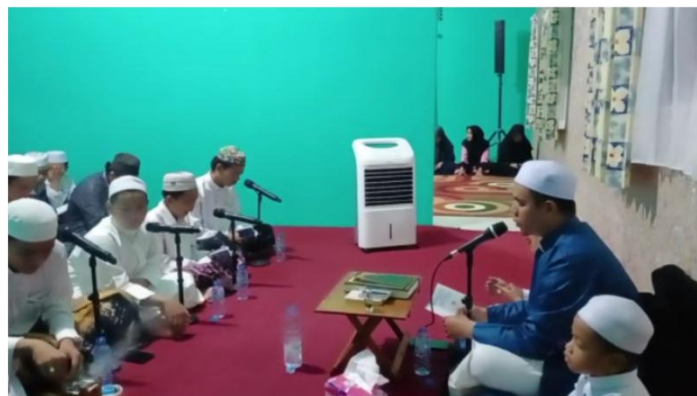
Kegiatan Pembacaan Simthu' Ad-Durar