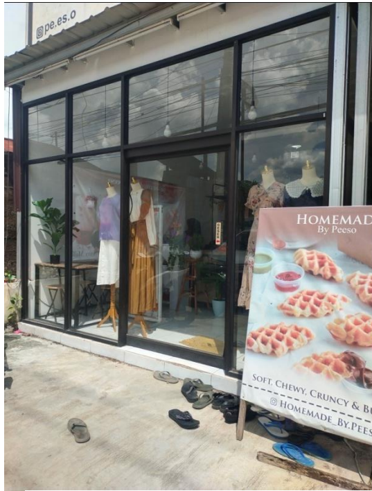
Pe.Es.O Thrift Store Cabang 1