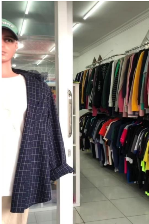
Pe.Es.O Thrift Store Cabang ke-3