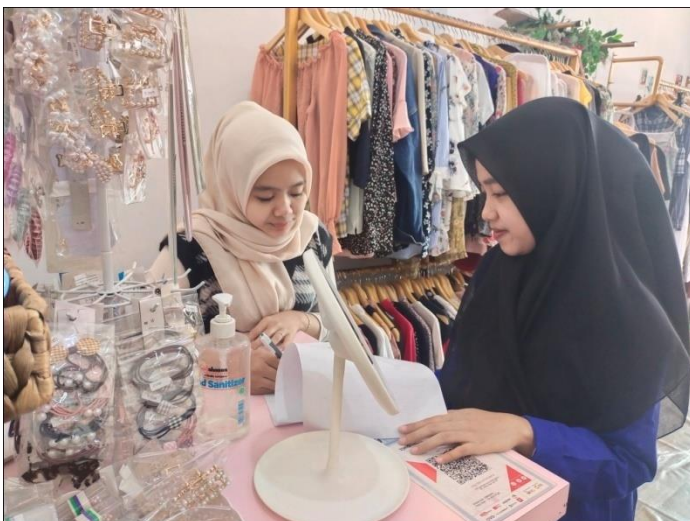
Memberikan Kuesioner kepada Responden