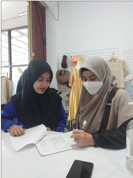
Memberikan Kuesioner kepada Responden