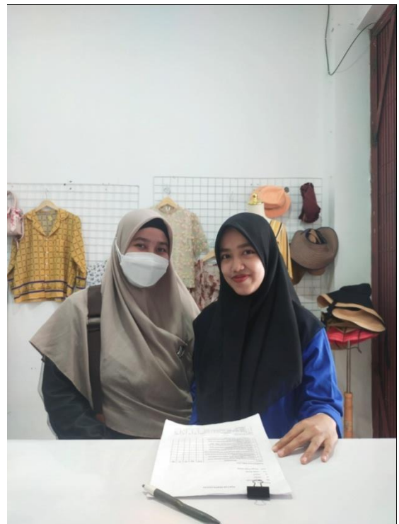
Foto Bersama Responden