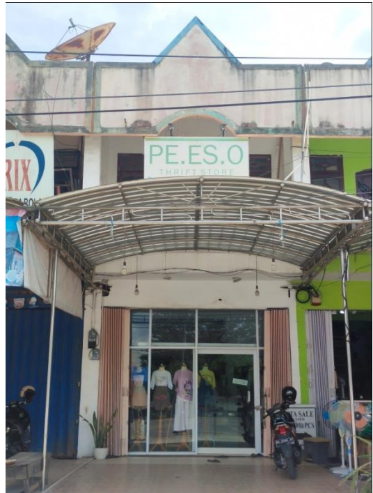
Pe.Es.O Thrift Store Cabang ke -2