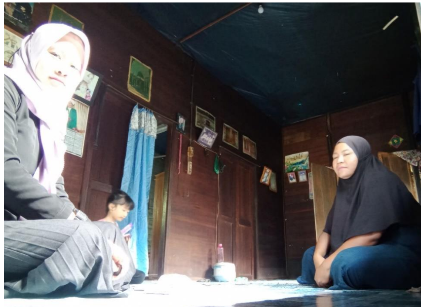
Gambar 4.5. Wawancara dengan Keluarga SR (cdf) 68

Foto diatas diambil pada saat melakukan wawancara antara peneliti dengan orang tua keluarga SR pada hari Jum'at tanggal 02 Juni 2023 jam 14.00 sampai selesai di rumah ibu SR sendiri, menanyakan mengenai pola asuhnya kepada anaknya.