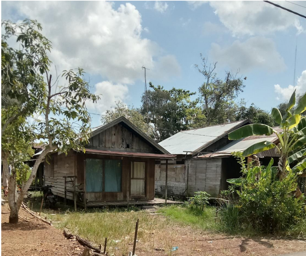
Gambar 4.2. Rumah Keluarga MZ (cdf) 65