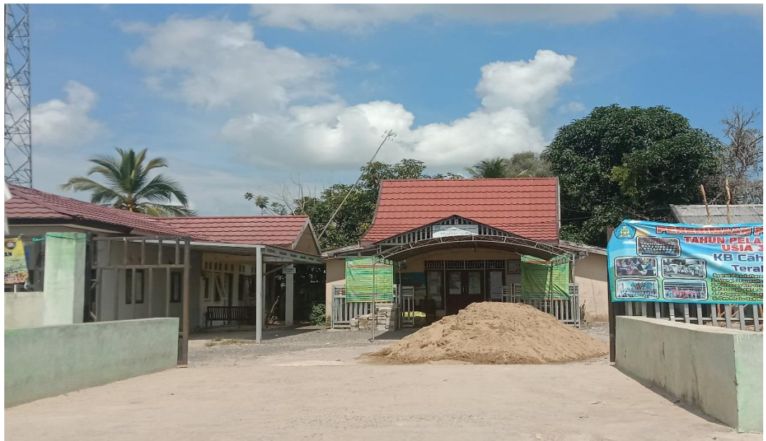
Gambar 4.1. Kantor Balai Desa Makmur (cdf) 64