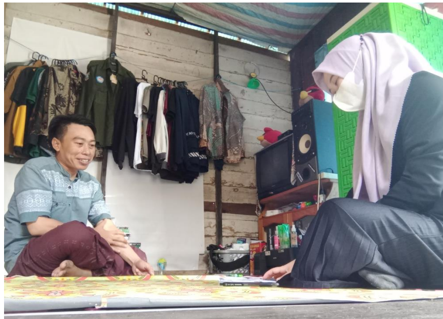
Gambar 4.4. Wawancara dengan keluarga MZ (cdf) 67

MZ mengatakan “ amun ulun menbarii inya hadiah kada suah pang, inya yang minta hadiah biasanya, amun ulun kawa ulun turuti ai. ”