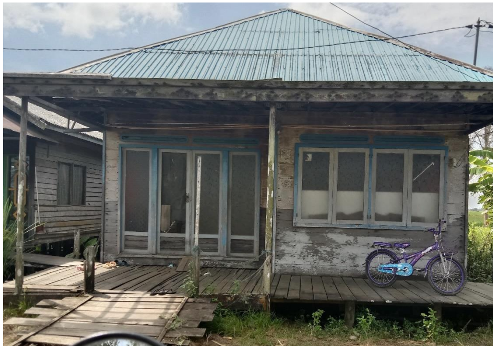
Gambar 4.3, Rumah Keluarga SR (cdf) 66

sekekali menjadi buruh tani di kampung. Tempat penelian yang ditempati SR yaitu di RT 4 desa Makmur serta memiliki rumah sendiri yang terbuat dari kayu.