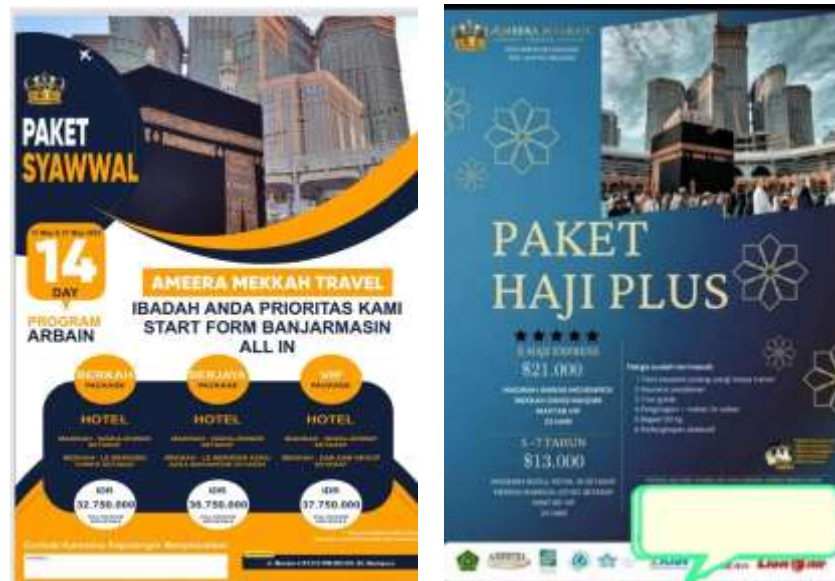
Gambar 4.1 Brosur Paket Umrah dan Haji Plus