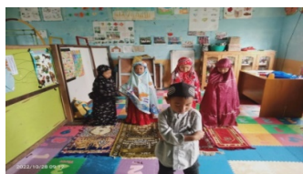
Gambar IV. 2 Foto Kegiatan Anak Jum'at Taqwa dan Mengenal Alam