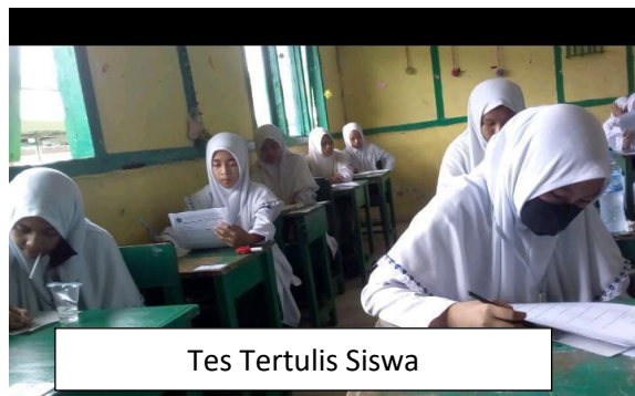
Tes Tertulis Siswa