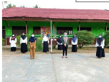
Guru Guru MTsN 8 HSS