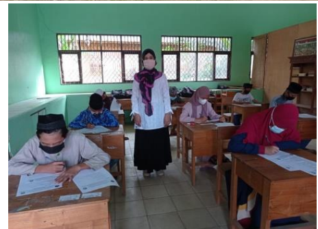
Kegiatan Belajar mengajar