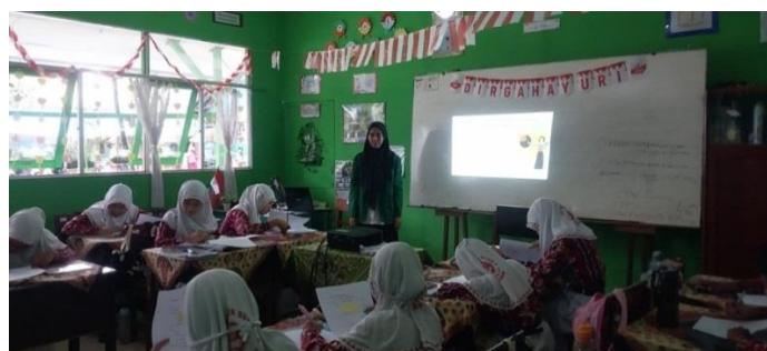
Gambar VIII Tahap Konstruktivisme

Guru meminta peserta didik untuk mengamati permasalahan yang diberikan pada layar.