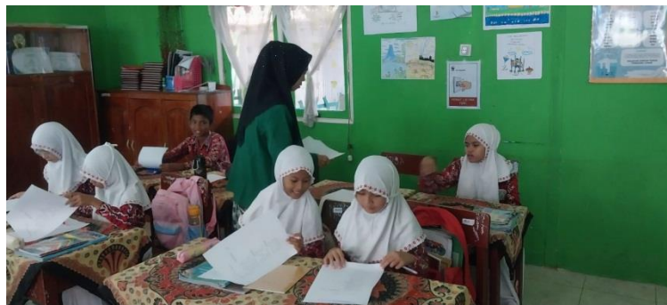
Gambar V Tahapan Preetest

Kegiatan inti merupakan kegiatan guru membagikan soal pretest .