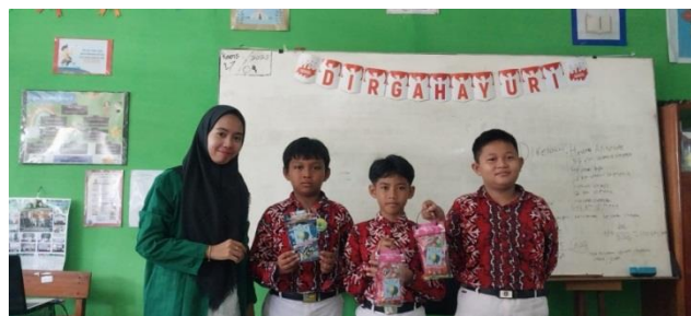
Gambar XII Tahapan Authentic Assessment

Guru membuat penilaian dari semua aspek.