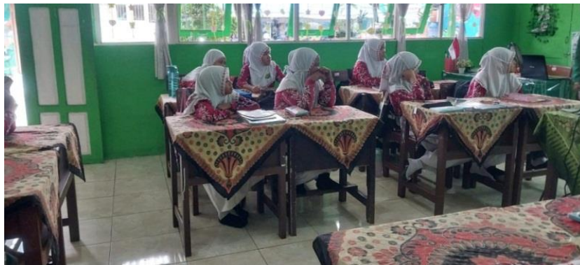
Gambar IX Tahap Learning Community