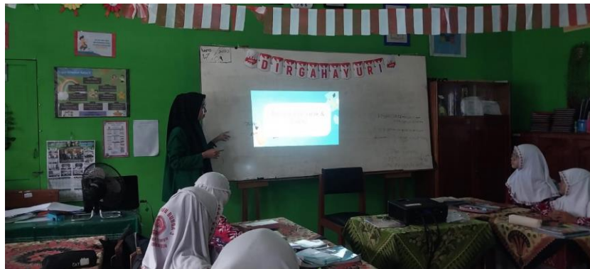
Gambar VI Tahap Konstruktivisme