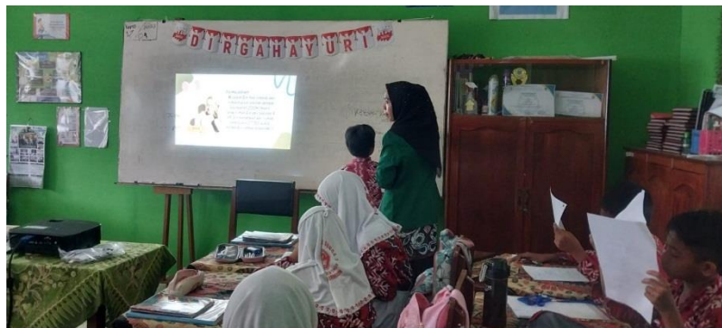
Gambar VII Tahap Modeling

Guru meminta salah satu siswa untuk menjawab serta menjelaskan kepada seluruh temannya didepan kelas, dan guru membimbing siswa untuk mencari informasi yang ada pada permasalahan yang diberikan, serta menjelaskan keterkaitan dengan matematika dalam kehidupan sehari-hari.