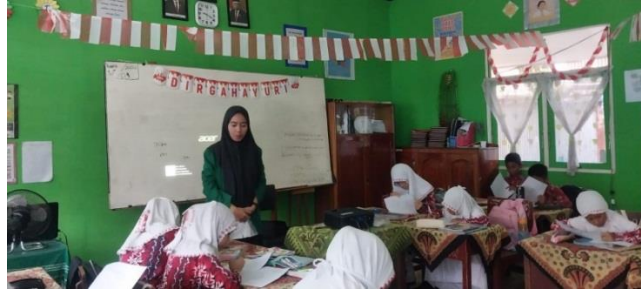
Gambar XI Tahapan Postest

Dan Setelah soal postest selesai dikerjakan,