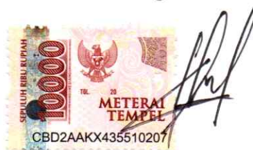
Yusril Ihza Mahendra

Banjarmasin, 15 Juni 2023 Yang Membuat Pernyataan