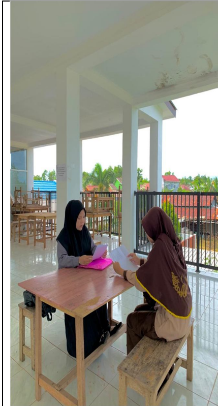
Wawancara dengan santriwati kelas i'dadi