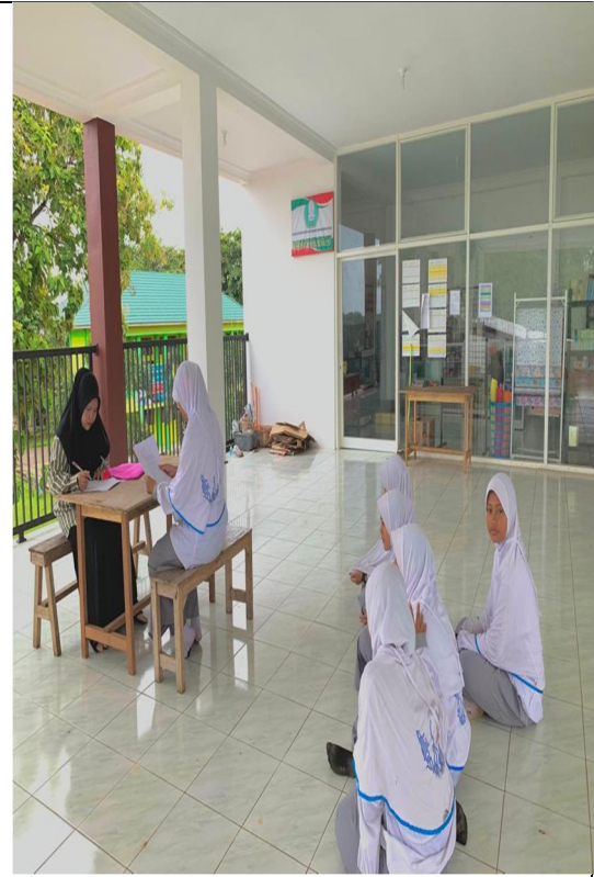
Wawancara dengan kelas i'dadi