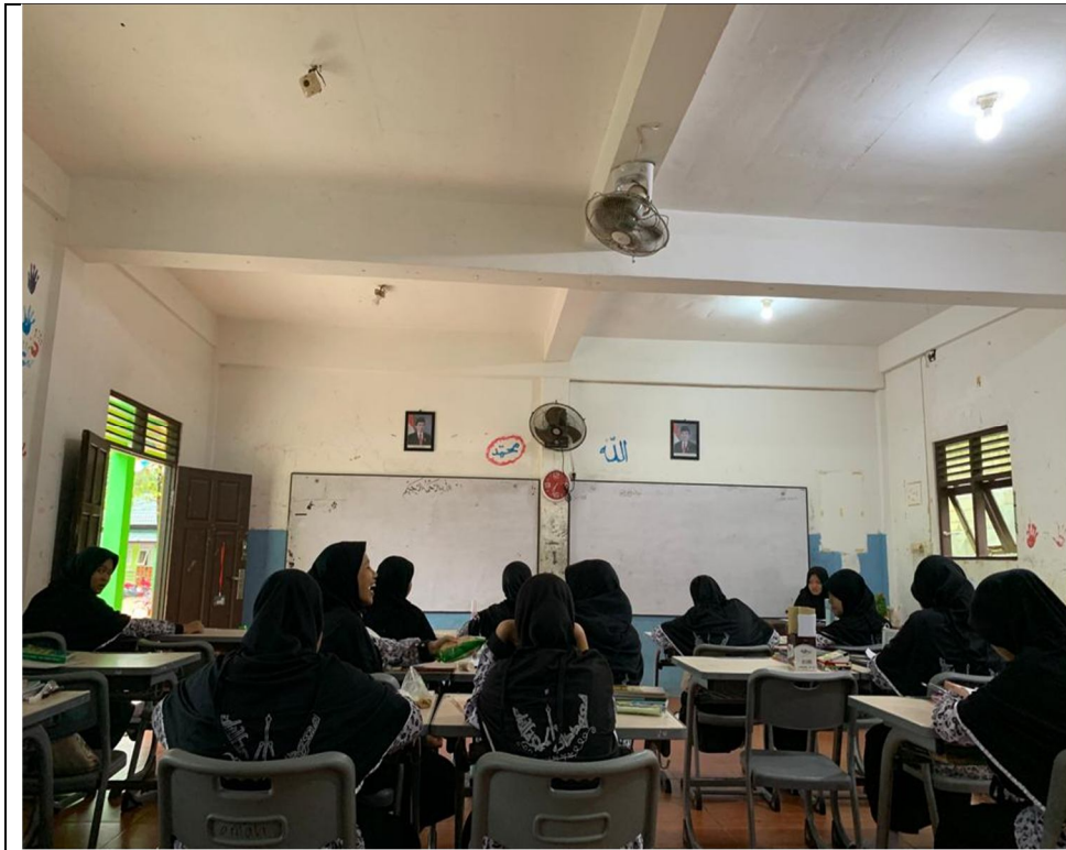
Ruang kelas i'dadi