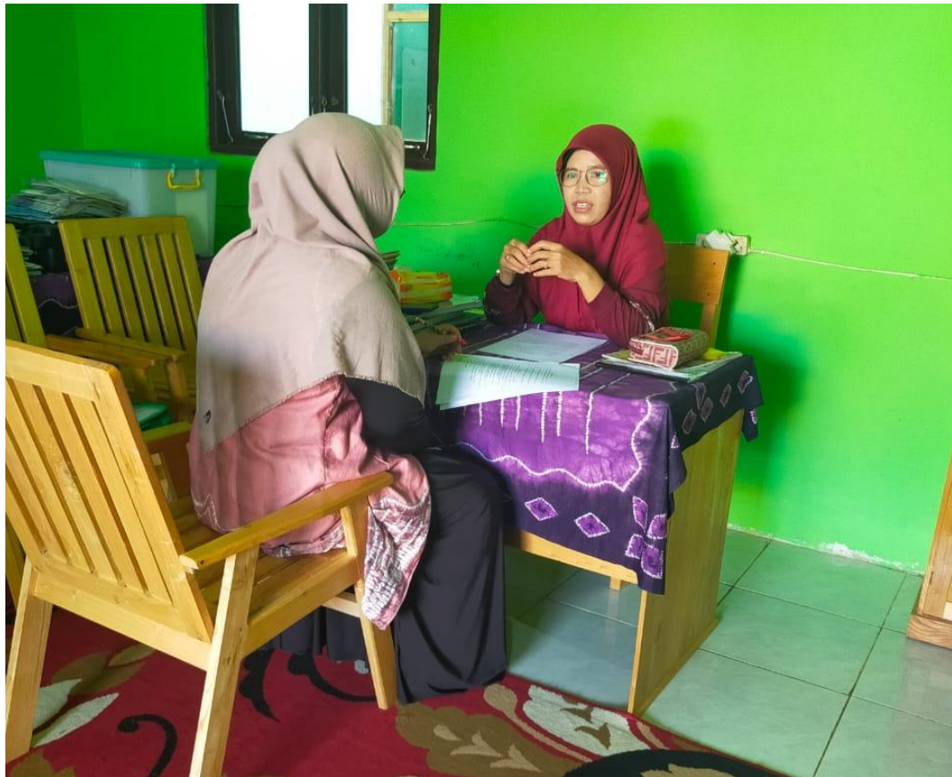
Wawancara dengan guru akidah akhlak MTsN 1 Banjar