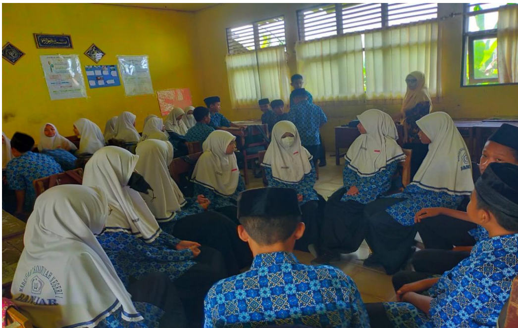
Kegiatan pembelajaran akidah akhlak siswa/i kelas VII materi asmaul husna