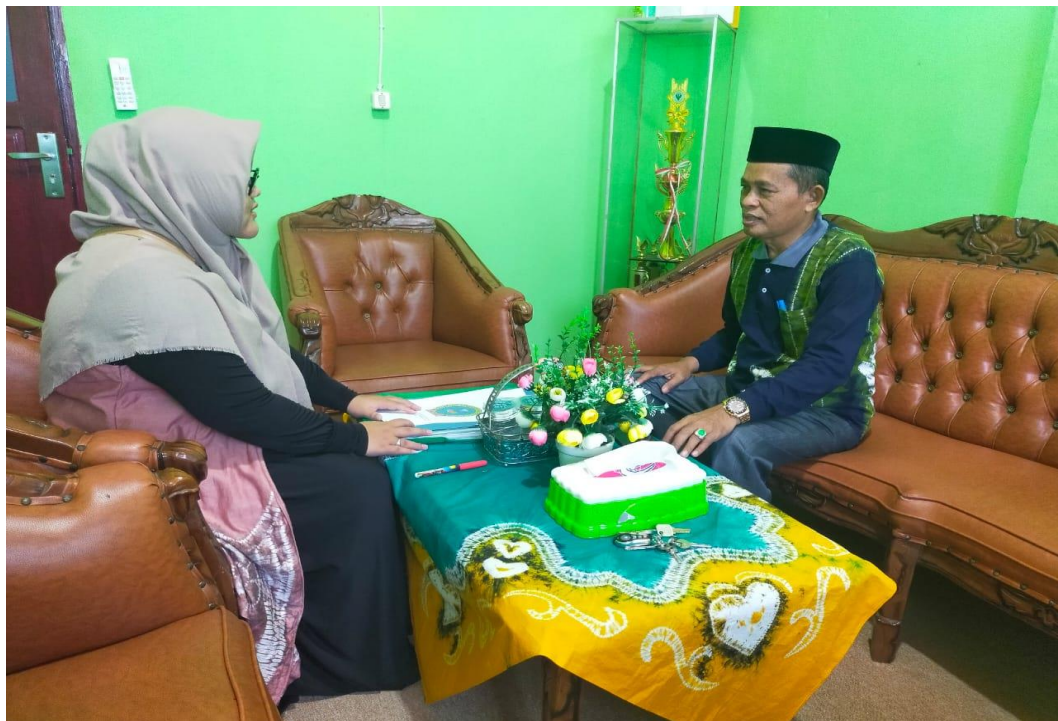
Wawancara dengan kepala sekolah MTsN 1 Banjar