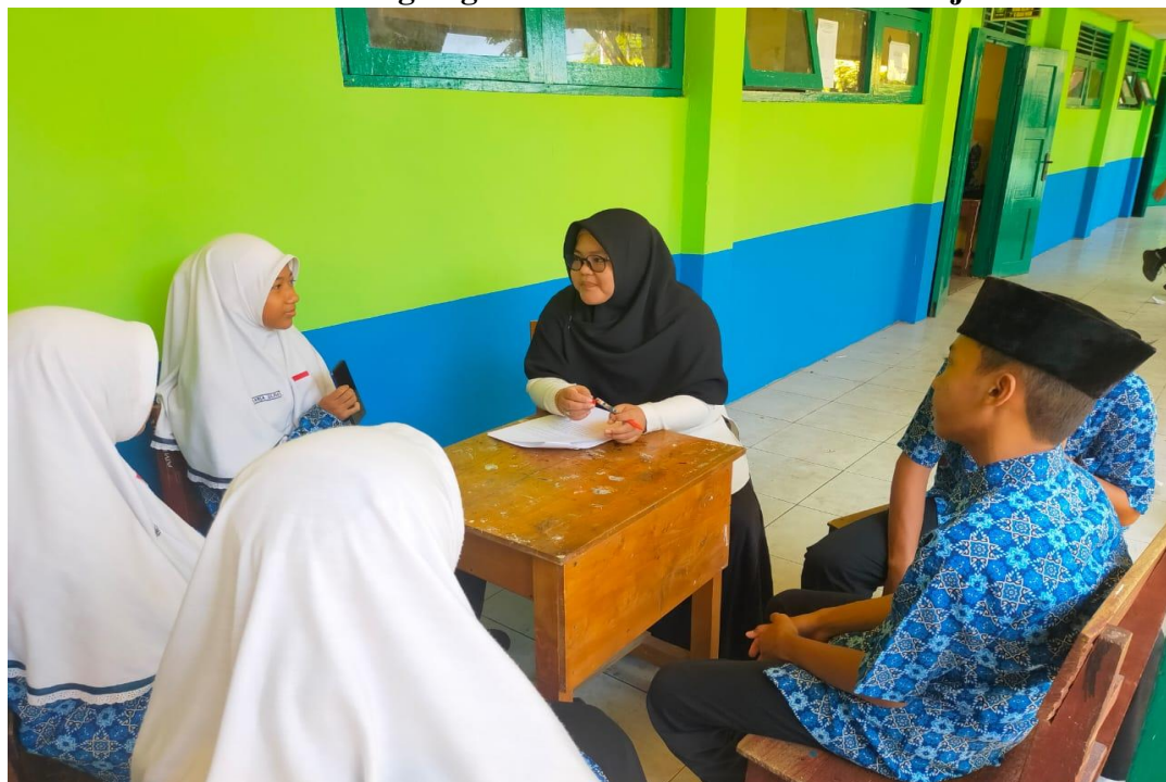
Wawancara dengan siswa/i kelas VII MTsN 1 Banjar