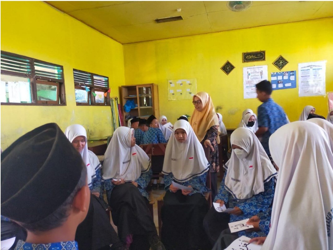
Kegiatan pembelajaran akidah akhlak siswa/i kelas VII materi asmaul husna