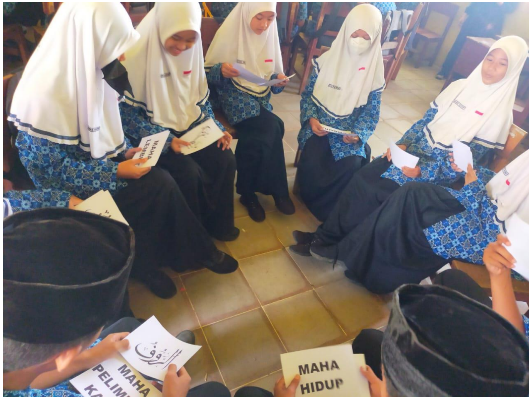
Kegiatan pembelajaran akidah akhlak siswa/i kelas VII materi asmaul husna