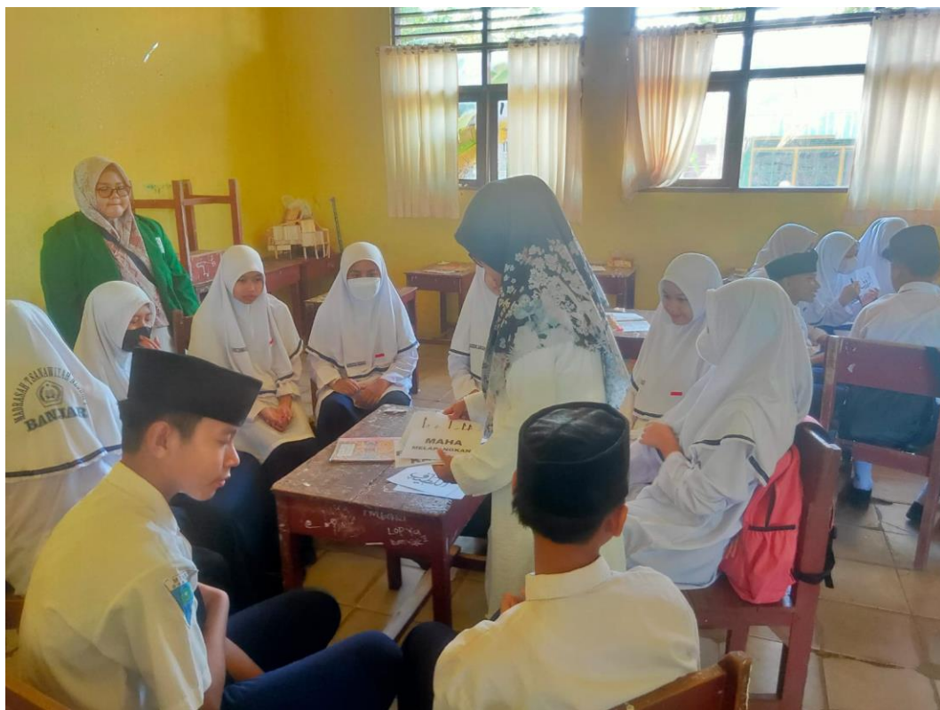
Kegiatan pembelajaran akidah akhlak siswa/i kelas VII materi asmaul husna