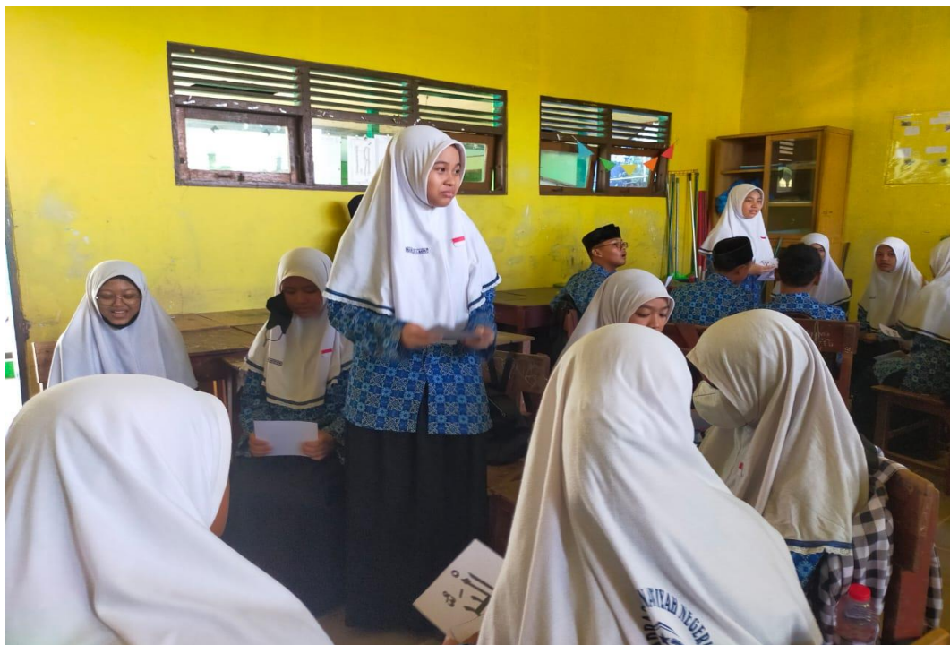
Kegiatan pembelajaran akidah akhlak siswa/i kelas VII materi asmaul husna