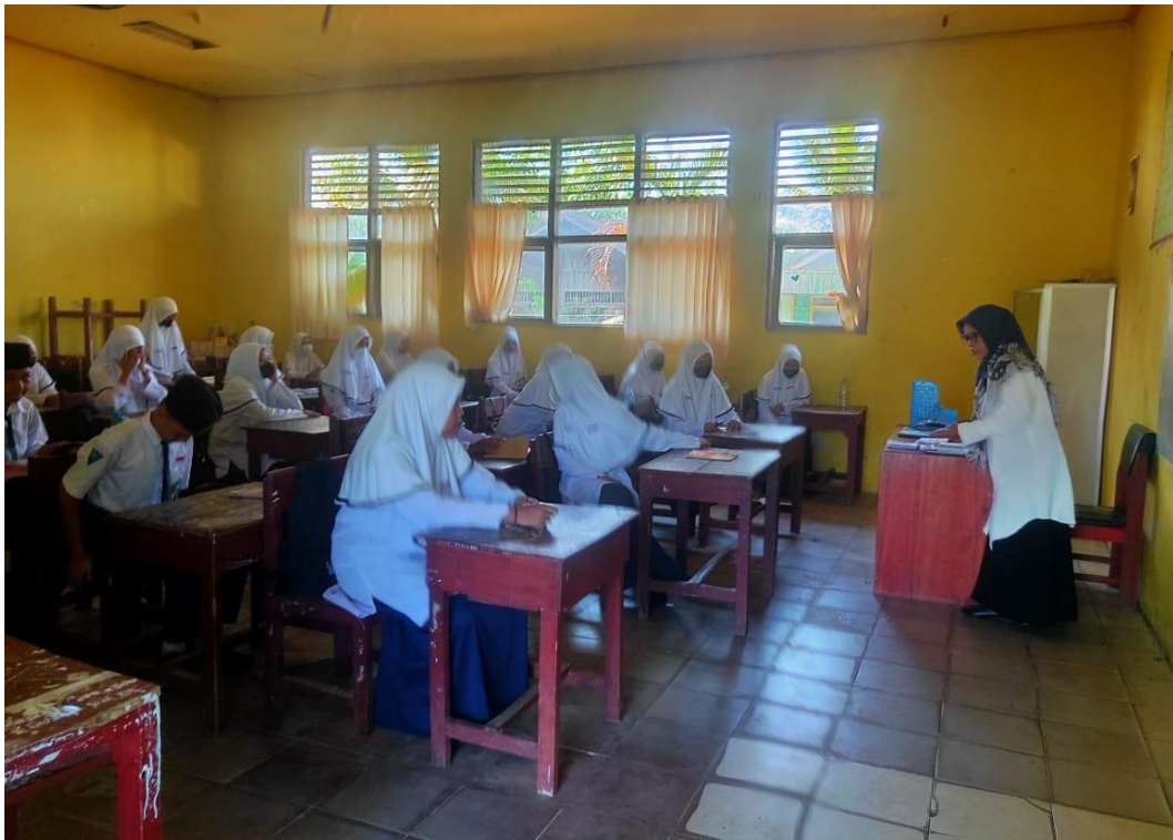
Kegiatan pembelajaran akidah akhlak siswa/i kelas VII materi asmaul husna