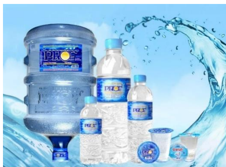
Gambar 4.2 Produk PT. Bandangantirta Agung

Perusahaan ini memproduksi produk dengan berbagai macam bentuk kemasan. Merek PROE memiliki beberapa bentuk kemasan, diantaranya kemasan cup 210 ml, botol 330 ml, botol 600 ml, botol 1500 ml, dan galon 19 liter. Adapun merek Galuh hanya memproduksi produk dengan kemasan cup 210 ml.