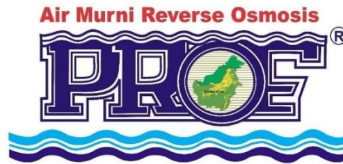
Gambar 4.1 Logo Produk PROE