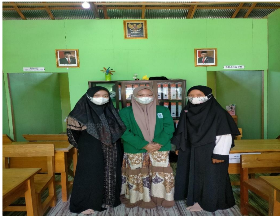
g. Foto berlangsungnya kegiatan Program Tahfidz