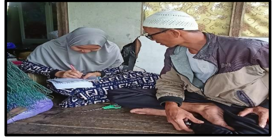
Wawancara dengan Tokoh Agama Desa Sungai Jingah Besar