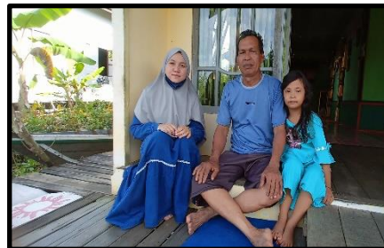
Wawancara dengan Kepala Desa serta ketua Rt Desa Sungai Jingah Besar