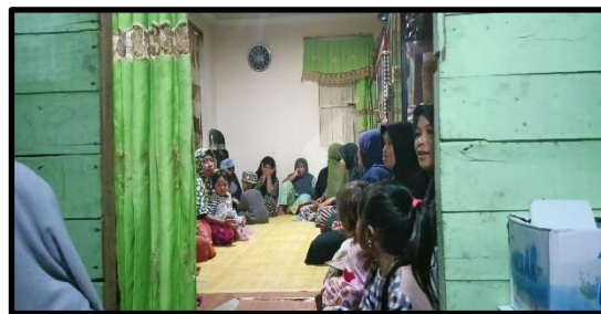
Masyarakat Melaksanakan Kegiatan Bapalas Kampung